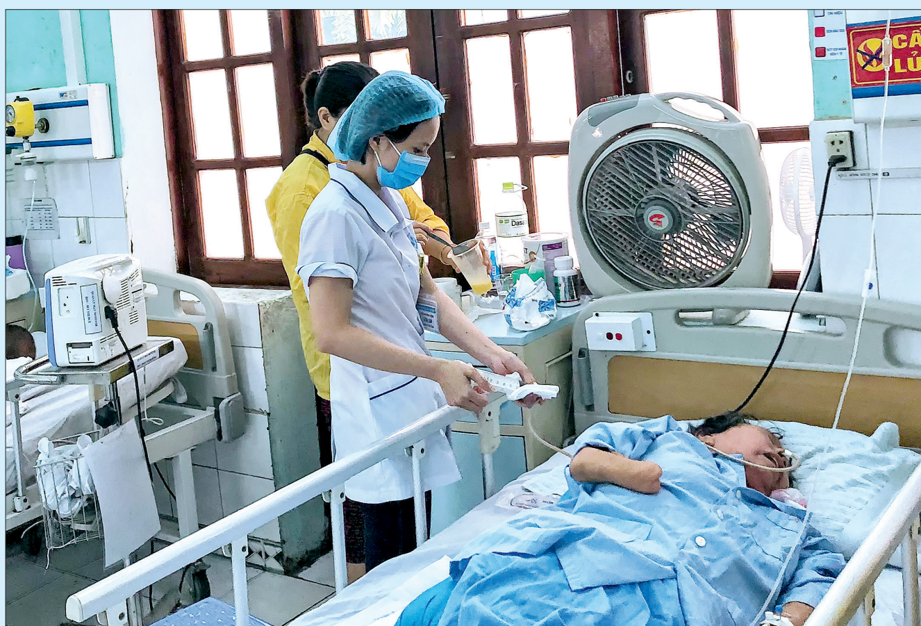
Bệnh nhân cao tuổi điều trị tại Trung tâm Tim mạch, Bệnh viện Đa khoa tỉnh.