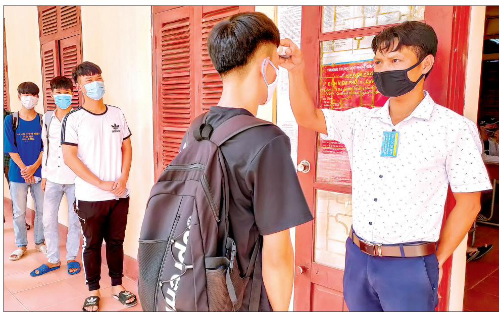
Cán bộ coi thi đo thân nhiệt cho thí sinh trước khi vào phòng thi.

Chiều ngày 8/8, tại 33 điểm thi, trên 19.000 thí sinh trong tỉnh đã đến các điểm thi làm thủ tục, nhận phòng thi kỳ thi tốt nghiệp THPT năm 2020.