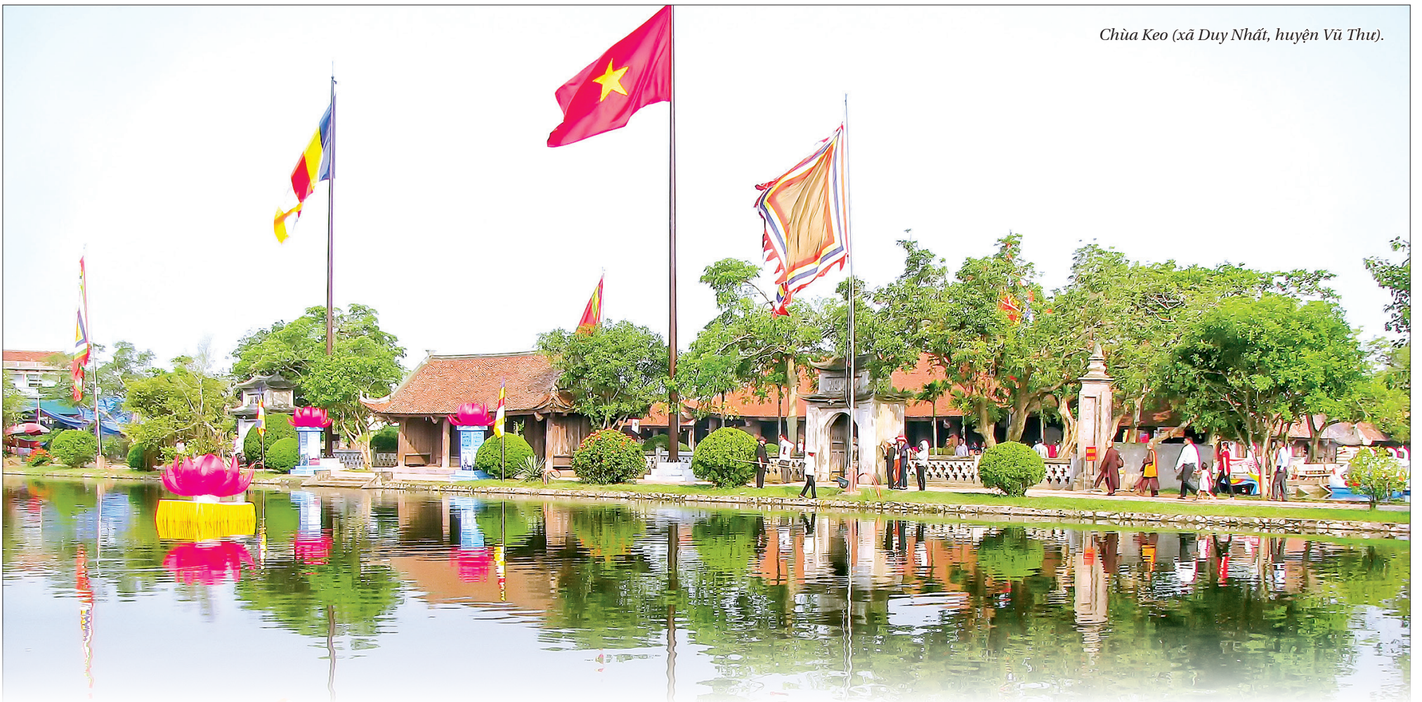
Chùa Keo (xã Duy Nhất, huyện Vũ Thư).