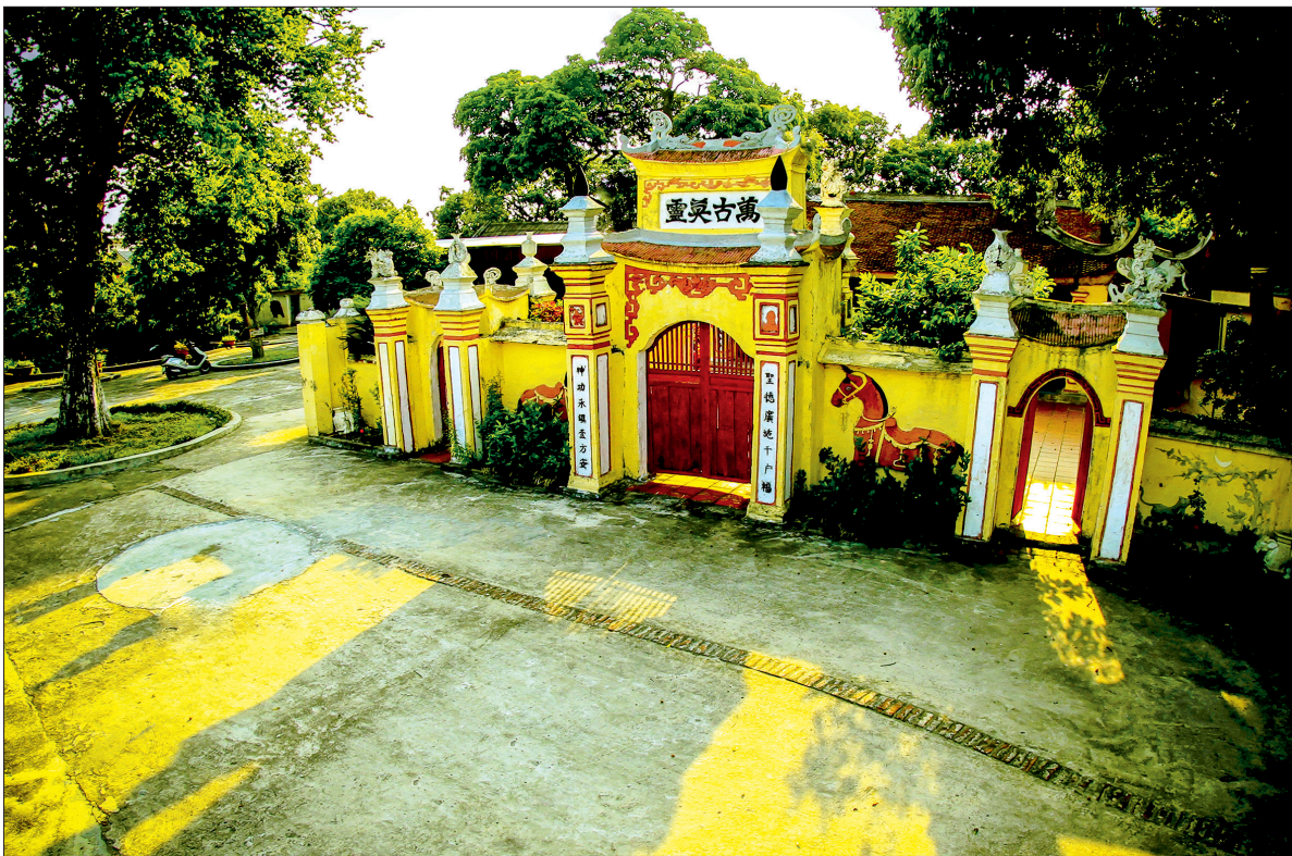
Đền Ngọc Quế - chứng tích lịch sử vùng đất cổ thời Hùng Vương.