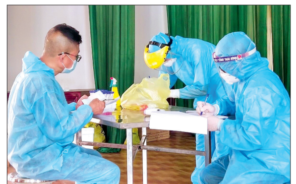
Công dân Việt Nam từ nước ngoài về khu cách ly tập trung của tỉnh được hướng dẫn khai báo y tế.

Tính đến ngày 8/8, tổng số mẫu đã xét nghiệm Covid-19 trên địa bàn tỉnh là 5.307 mẫu, tăng 187 mẫu so với ngày 7/8.