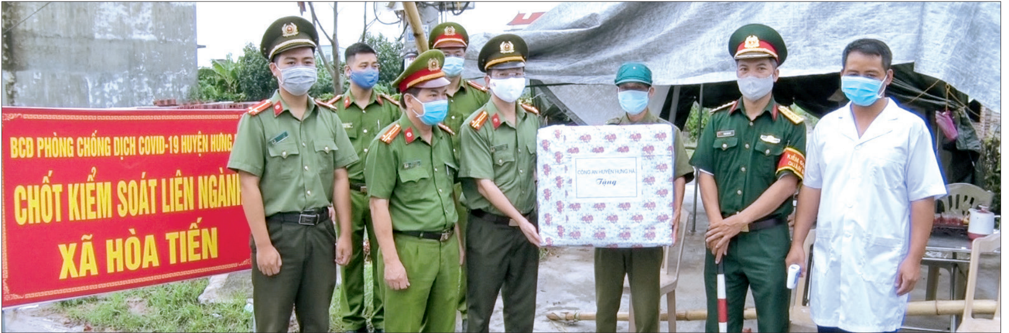
Lãnh đạo Công an huyện Hưng Hà thăm, tặng quà chốt kiểm soát dịch bệnh tại xã Hòa Tiến (Hưng Hà).