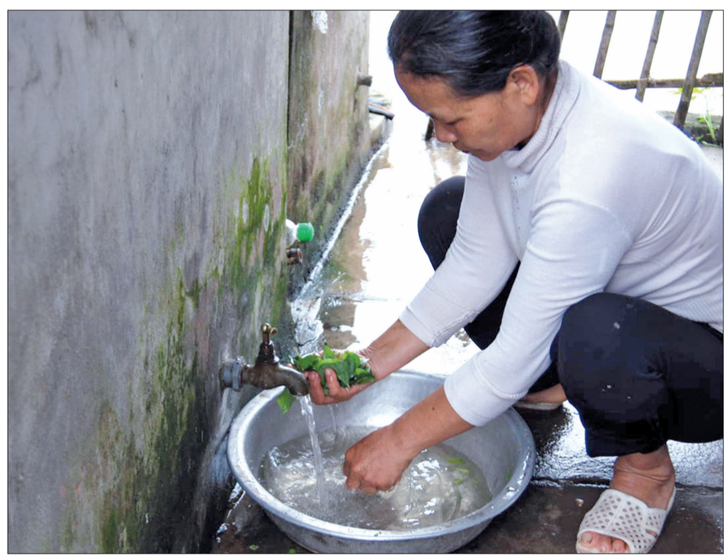
Người dân xã Nam Bình (Kiến Xương) sử dụng nước sinh hoạt.