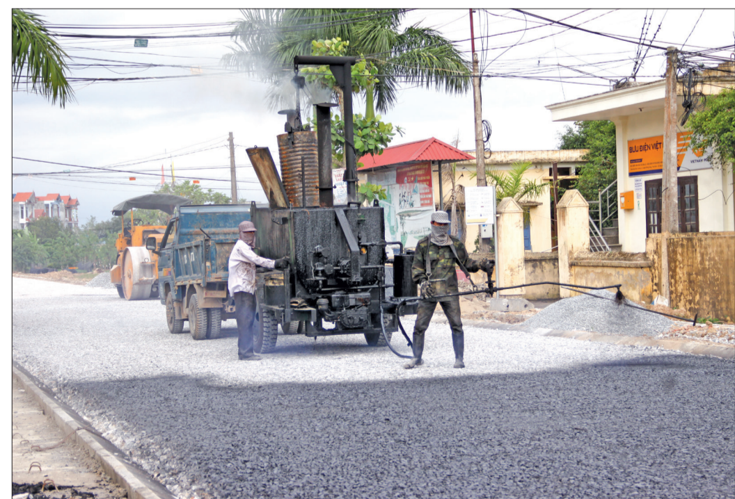
Công ty Cổ phần Đầu tư xây dựng Lam Sơn Thái Bình huy động nhân lực, vật tư đầy nhanh tiến độ thi công đường ĐH.48 đoạn qua địa phận xã Hoa Lư (Đông Hưng).