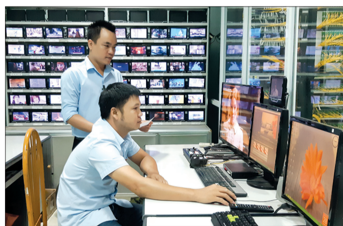
Kiểm tra kỹ thuật tại Phòng Truyền dẫn phát sóng (Trung tâm Truyền hình cấp Thái Bình).

tinh thần đoàn kết, thống nhất, chủ động khắc phục khó khăn, hoàn thành tốt nhiệm vụ được giao, Trung tâm đã quan tâm đầu tư nâng cấp hệ thống hạ tầng kỹ thuật như áp dụng ngầm hóa mạng cáp quang truyền dẫn, mở rộng dung lượng truyền dẫn... giúp bảo đảm tín hiệu, nâng cao chất lượng dịch vụ hướng tới sự hài lòng của khách hàng. Đặc biệt, các phong trào thi đua lao động, sản xuất, kinh doanh thường xuyên được triển khai, duy trì, tạo động lực và khí thế trong đơn vị. Nhiều sáng kiến cải tiến kỹ thuật, đề tài nghiên cứu khoa học đã được Trung tâm áp dụng vào thực tế mang lại hiệu quả cao. Từ những cải tiến kỹ thuật đầu tiên như chuyển hệ thống mạng quang hình sao sang mạng vòng Ring giúp kết nối hệ thống cáp quang tránh sự cố mất tín hiệu mạng THC trên toàn tỉnh. Đội ngũ kỹ sư của Trung tâm đã tập trung nghiên cứu và triển khai hàng loạt các công trình như nâng cấp các HUB tại 7 huyện, nâng tỷ