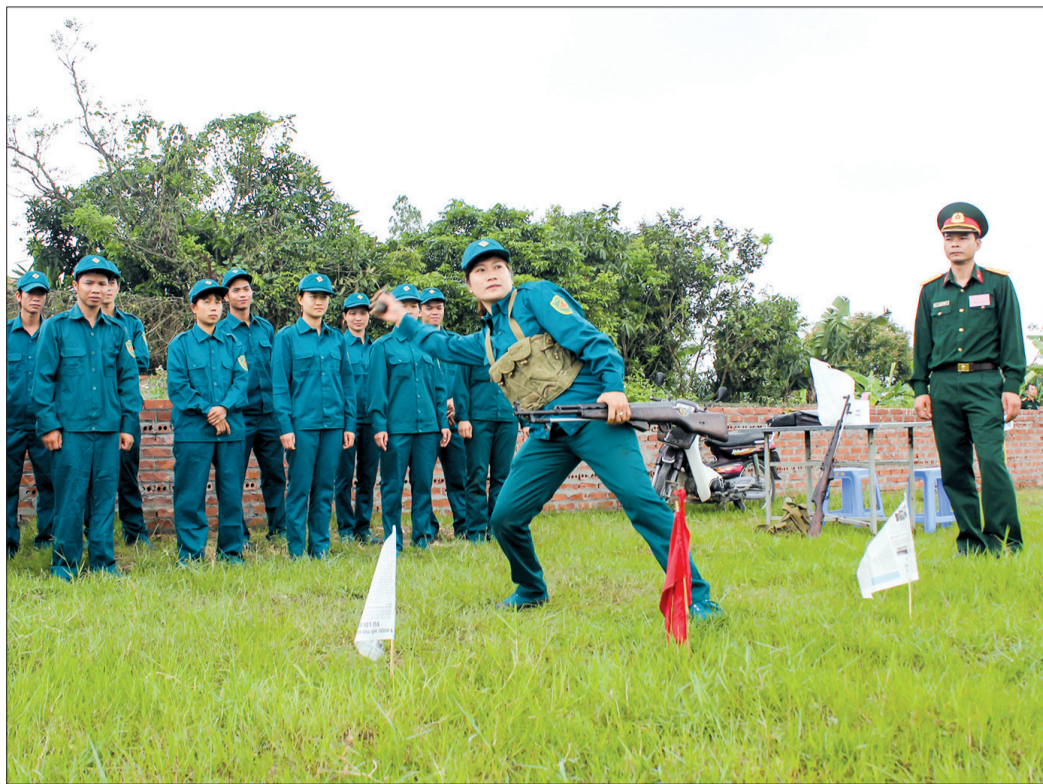
Lực lượng dân quân, tự vệ huyện Đông Hưng tham gia huấn luyện.