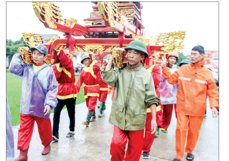
Nghi lễ rước kiệu của nhân dân địa phương tại lễ hội Vạn Xuân.

Trong khuôn khổ lễ hội Vạn Xuân tại khu di tích lịch sử văn hóa cấp quốc gia miếu Hai Thôn, trước đó, tối ngày 18/3 đã diễn ra lễ cầu an. Đồng chí Trần Thị Bích Hằng, Tỉnh ủy viên, Phó Chủ tịch UBND tỉnh cùng các đồng chí lãnh đạo địa phương và đông đảo nhân dân tới dự.