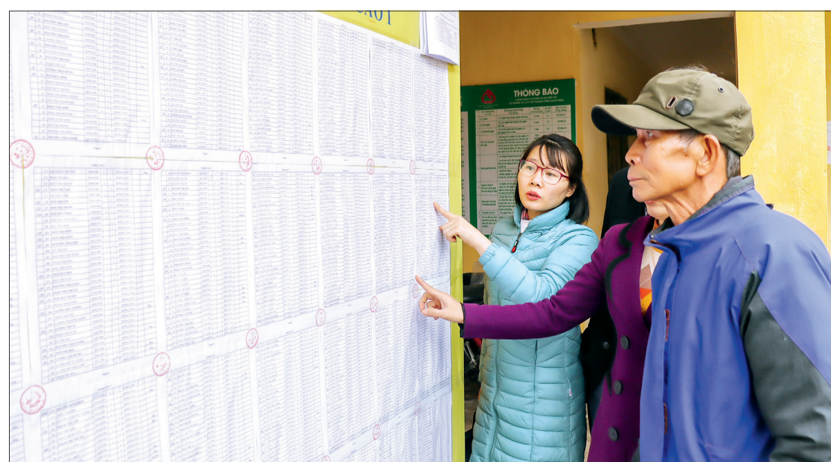
Người dân xã Tây Tiến (Tiền Hải) theo dõi danh sách cử tri được niêm yết công khai tại trụ sở UBND xã.