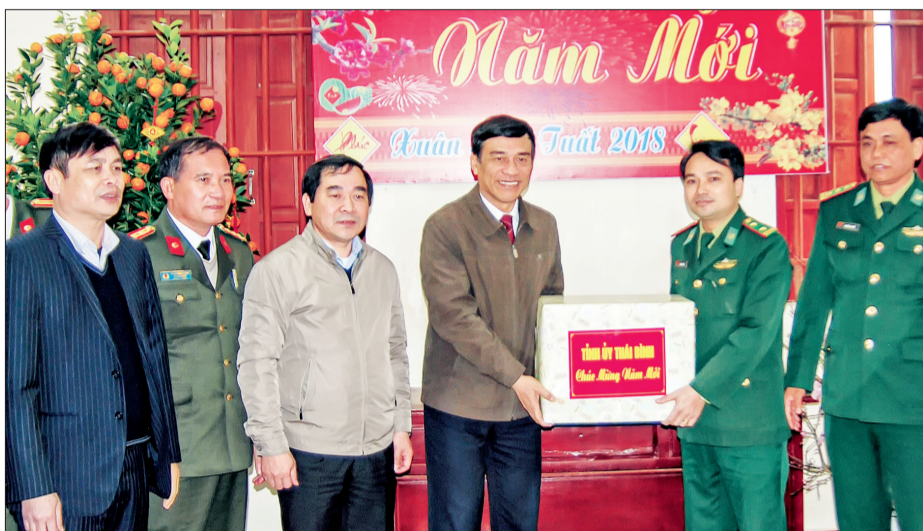
Đồng chí Đặng Trọng Thăng, Phó Bí thư thường trực Tỉnh ủy, Chủ tịch HĐND tỉnh chúc tết cán bộ, chiến sĩ Đồn Biên phòng Cửa Lân.