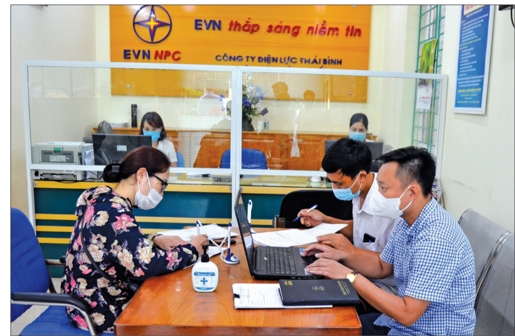
Khách hàng đăng ký lắp đặt công tơ điện mới trên hệ thống phần mềm.