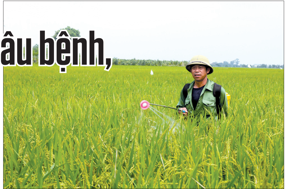
Nông dân xã Quỳnh Hải (Quỳnh Phụ) phòng, trừ sâu bệnh, bảo vệ lúa xuân cuối vụ.