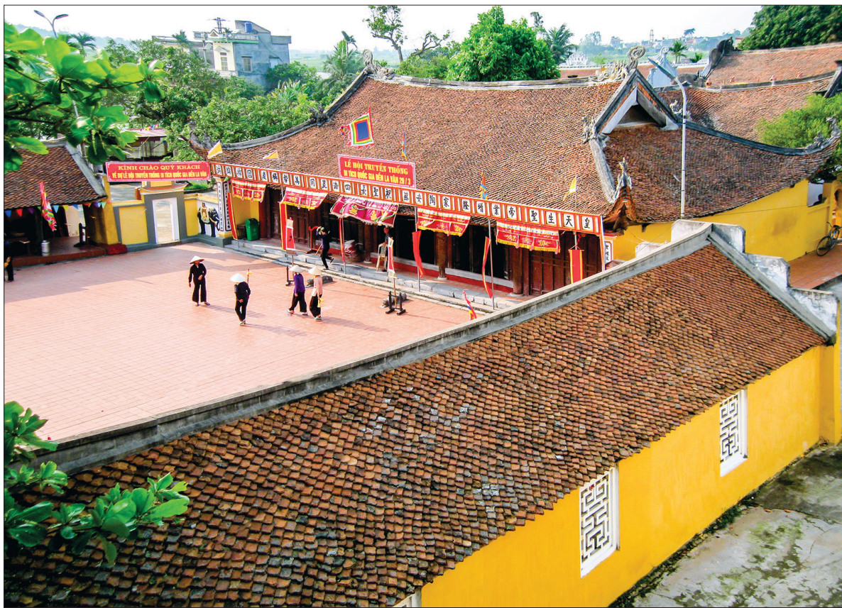
Cụm đình, đền, chùa La Vân, xã Quỳnh Hồng (Quỳnh Phụ).