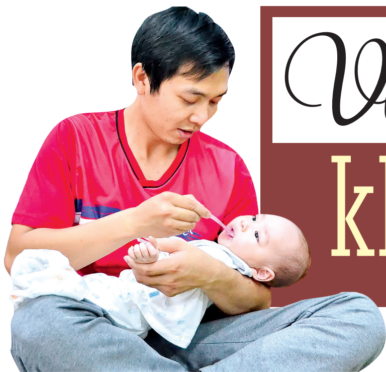
Chồng san sẻ việc chăm sóc con với vợ khiến vợ cảm kích vì được chồng quan tâm chia sẻ, yêu thương.