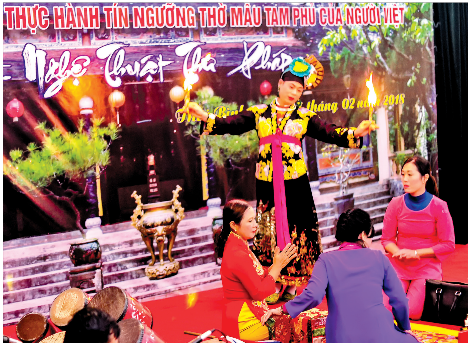
Thực hành tín ngưỡng thờ Mẫu tam phủ do đội hầu đồng đền Đông Bằng, xã An Lễ, huyện Quỳnh Phụ thực hiện.

Tương truyền cõi Nam Giao đất rộng, dân đông cần có bậc “Mẫu nghi” chăm sóc, việc này vốn trước đã được giao cho tiên nữ Quỳnh Cung, cư dân Thái Bình tự thuở khai cơ mở vận đã được hưởng ân đức bậc đại tiên nữ nên bao đời nay vẫn phụng thờ ngài.