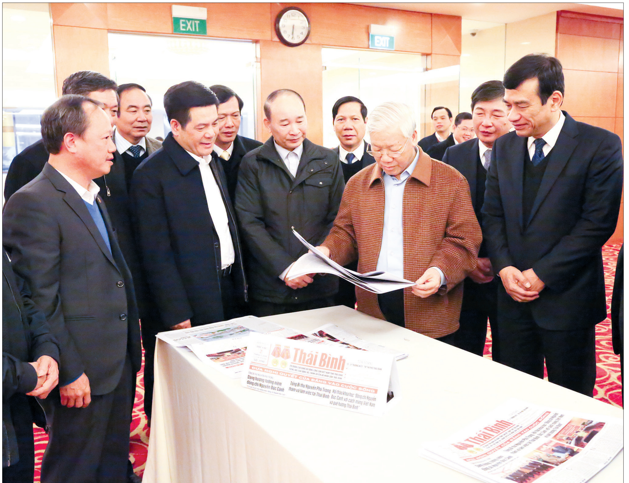
Tổng Bí thư Nguyễn Phú Trọng xem Báo Thái Bình số ra ngày 2/2/2018.