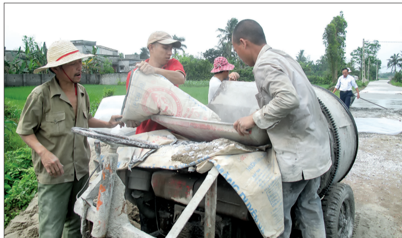
Nhờ cơ chế hỗ trợ xi măng, nhân dân Thái Bình phấn khởi góp sức xây dựng cơ sở hạ tầng.

30.766m đường trục xã, đường trục thôn, đường nhánh cấp 1, đường ngõ xóm và đường trục chính nội đồng được trải nhựa, bê tông hóa; có 3 trường học, trạm y tế đều đạt chuẩn quốc gia; 3/3 thôn có nhà văn hóa... đã làm thay đổi hoàn toàn diện mạo nông thôn nơi đây. Chủ tịch UBND xã Đàm Xuân Lược cho biết: Điểm đổi thay rõ nét nhất của Thụy Phúc là đời sống của người dân ngày một nâng cao. Hiện tại, tỷ lệ hộ nghèo của xã chỉ còn 1,52%, thu nhập bình quân đầu người năm 2018 ước đạt 42,5 triệu đồng. Nguyên nhân thành công là do Đảng bộ, chính quyền xã luôn dựa vào nhân dân, nhân dân thật sự là người chủ xây dựng NTM, là