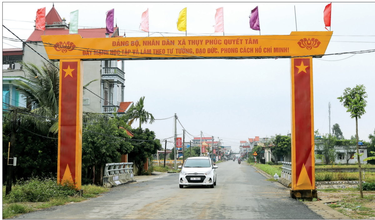
Diện mạo nông thôn mới ở xã Thụy Phúc (Thái Thụy).

Một trong những nguyên nhân xảy ra mất ổn định chính trị ở Thái Bình những năm 1997 - 1999 đã được Đảng bộ tỉnh xác định là do huy động quá sức dân và mất dân chủ trong đầu tư xây dựng cơ sở hạ tầng. Thế nhưng, những năm qua Thái Bình cũng huy động sức dân xây dựng nông thôn mới (NTM) không chỉ vượt lên là một trong những tỉnh dẫn đầu cả nước trong phong trào này mà còn giữ vững ổn định tình hình chính trị, an ninh nông thôn.