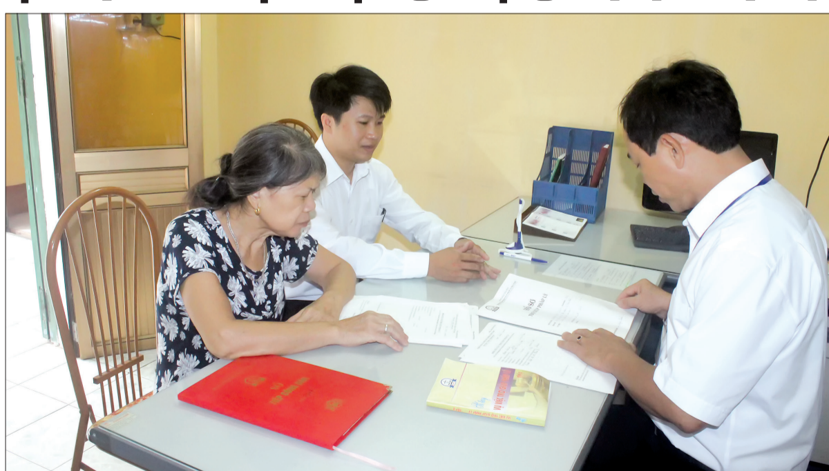
Cán bộ Trung tâm Trợ giúp pháp lý nhà nước, Sở Tư pháp trợ giúp pháp lý cho người dân.

Những năm qua, công tác trợ giúp pháp lý (TGPL) trên địa bàn tỉnh đã mang lại hiệu quả tích cực, giúp bảo vệ quyền và lợi ích hợp pháp, chính đáng cho các đối tượng chính sách, người nghèo, người khuyết tật, góp phần giảm bớt những vụ việc vi phạm pháp luật, nâng cao ý thức thượng tôn pháp luật trong nhân dân.