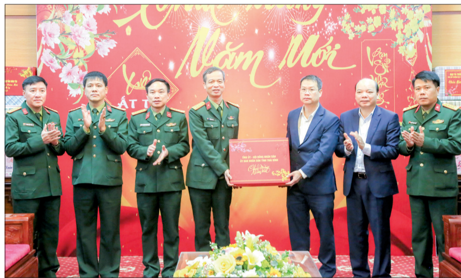
Đồng chí Nguyễn Mạnh Hùng, Phó Bí thư Tỉnh ủy, Chủ tịch UBND tỉnh chúc tết cán bộ, chiến sĩ Bộ CHQS tỉnh.

phối hợp với ban, ngành, đoàn thể, địa phương vận động, tuyên truyền nhân dân thực hiện nghiêm Luật số 42 và Nghị định số 137. Cùng với đó, Bộ CHQS tỉnh cũng chỉ đạo các cơ quan, đơn vị điều chỉnh, bổ sung kế hoạch sẵn sàng chiến đấu; luyện tập các phương án, chuẩn bị đầy đủ lực lượng, phương tiện sẵn sàng cơ động thực hiện nhiệm vụ khi có lệnh; đồng thời, hiệp đồng với các sở, ngành của tỉnh và các đơn vị, cơ quan Quân khu 3, Bộ Quốc phòng về bảo đảm pháo hoa, triển khai làm tốt công tác chuẩn bị bảo đảm bản tại 11 điểm trên địa bàn tỉnh.