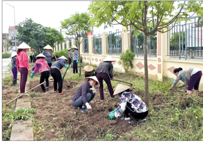
Phụ nữ xã Vũ Hòa (Kiến Xương) thực hiện tốt cuộc vận động "5 không, 3 sạch".

Thực hiện Chỉ thị số 05 của Bộ Chính trị về đẩy mạnh học tập và làm theo tư tưởng, đạo đức, phong cách Hồ Chí Minh, Đảng bộ huyện Kiến Xương đã triển khai đồng bộ nhiều giải pháp, vận dụng phù hợp với tình hình thực tiễn, tạo sức lan tỏa đến từng cán bộ, đảng viên và các tầng lớp nhân dân.