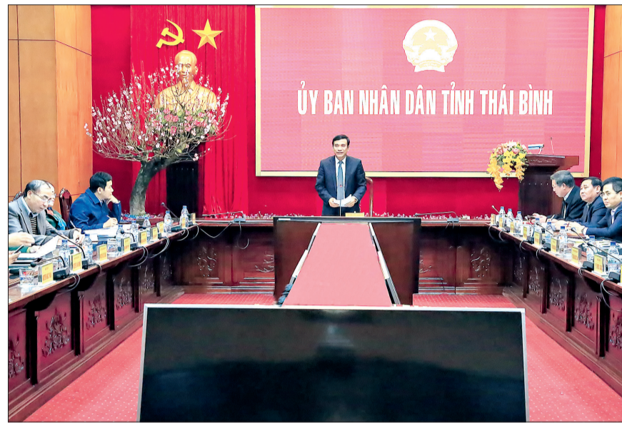
Đồng chí Đặng Trọng Thăng, Phó Bí thư Tỉnh ủy, Bí thư Ban Cán sự đảng, Chủ tịch UBND tỉnh phát biểu tại hội nghị.