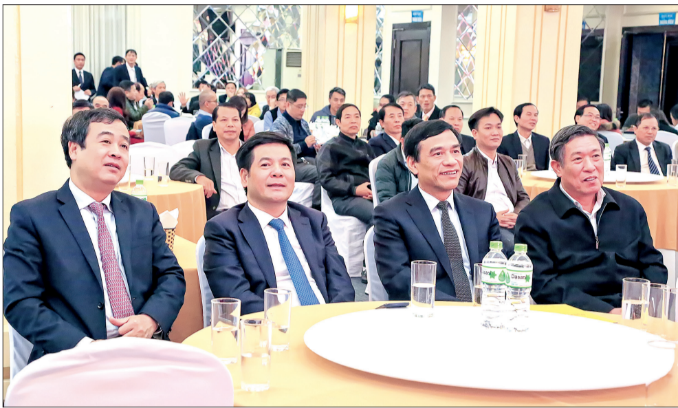
Các đồng chí lãnh đạo tỉnh dự buổi gặp mặt.