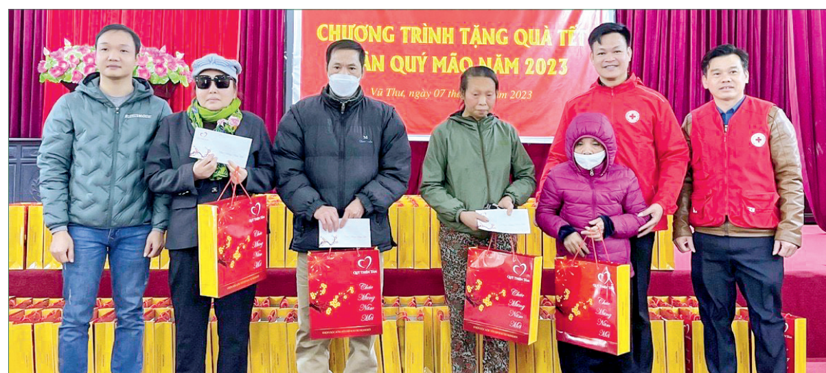
Hội Chữ thập đỏ tỉnh, Hội Chữ thập đỏ huyện Vũ Thư trao quà tết cho người nghèo.