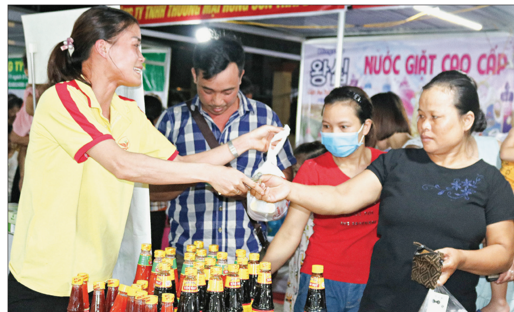
Phiên chợ hàng Việt về nông thôn giúp doanh nghiệp đưa sản phẩm tới gần người tiêu dùng hơn.