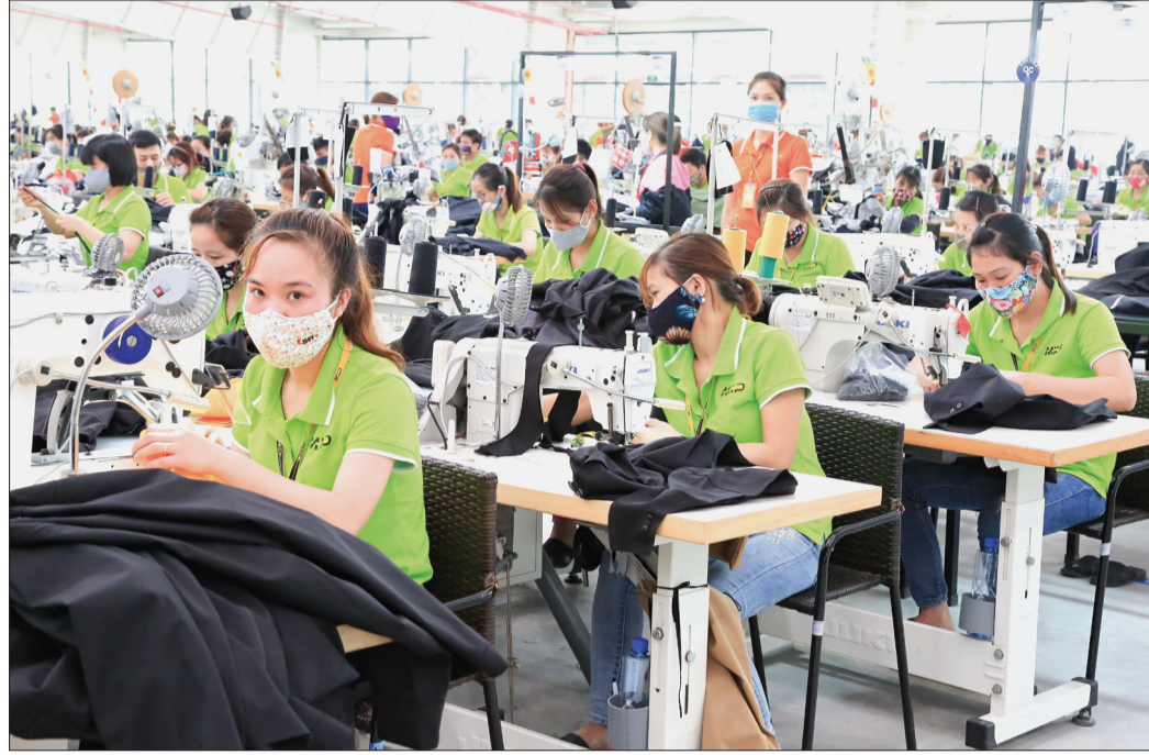
Mặc dù bị ảnh hưởng của dịch Covid-19 nhưng Công ty Cổ phần Sản xuất hàng thể thao MXP vẫn duy trì đủ việc làm cho công nhân với 8 giờ/ngày.

Nổi bật nhất trong bức tranh kinh tế 6 tháng của Thái Bình. Chính điều đó đã tạo tiền đề quan trọng giúp tỉnh tăng cường thu hút đầu tư, từ đó phát triển kinh tế theo hướng hiện đại, bền vững. 6 tháng đầu năm, toàn tỉnh có 43 dự án được phê duyệt, điều chỉnh chủ trương đầu tư hoặc được cấp, điều chỉnh giấy chứng nhận đăng ký đầu tư với tổng vốn đăng ký mới và tăng thêm trên 2.620 tỷ đồng; trong đó có 3 dự án đầu tư trực tiếp nước ngoài với tổng vốn đăng ký hơn 25,8 triệu USD. Cùng với đó, tỉnh cũng tích cực chỉ đạo thực hiện các giải pháp hỗ trợ doanh nghiệp, đặc biệt là các giải pháp hỗ trợ về nguồn vốn tín dụng ngân hàng; đồng