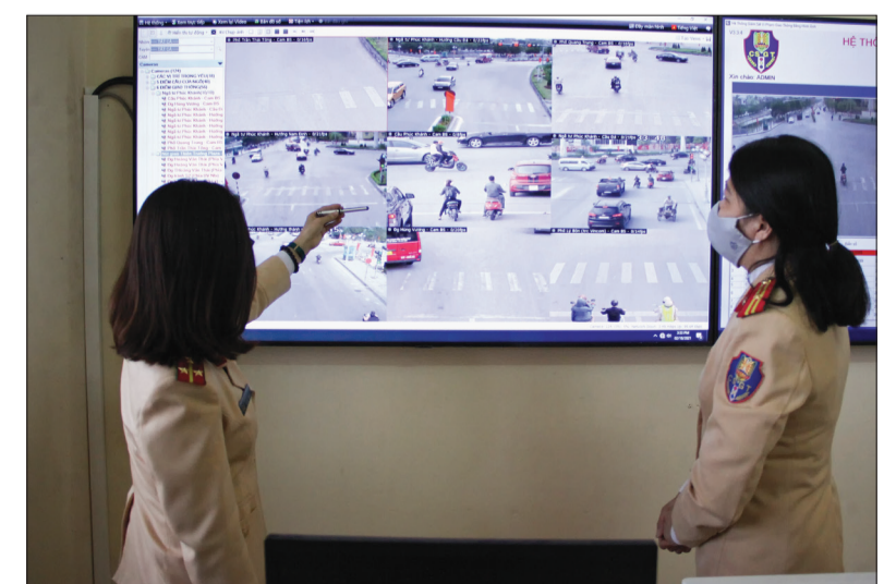
Lực lượng cảnh sát giao thông trao đổi nghiệp vụ về phạt “nguội” hành vi vi phạm pháp luật về bảo đảm trật tự an toàn giao thông.