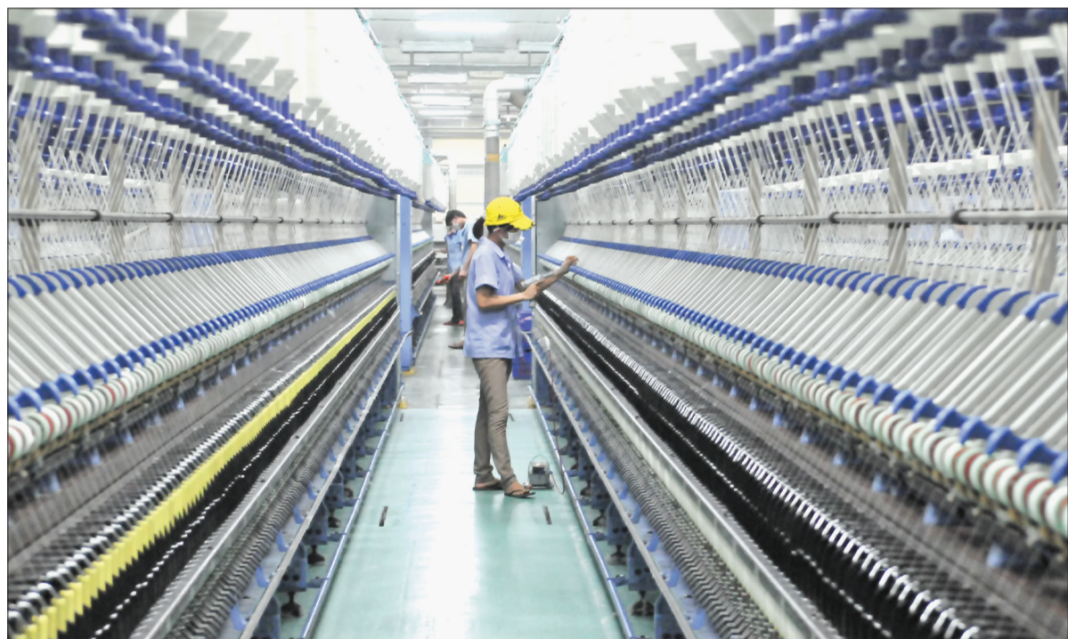
Hoạt động sản xuất tại Công ty Cổ phần Sợi Trà Lý.