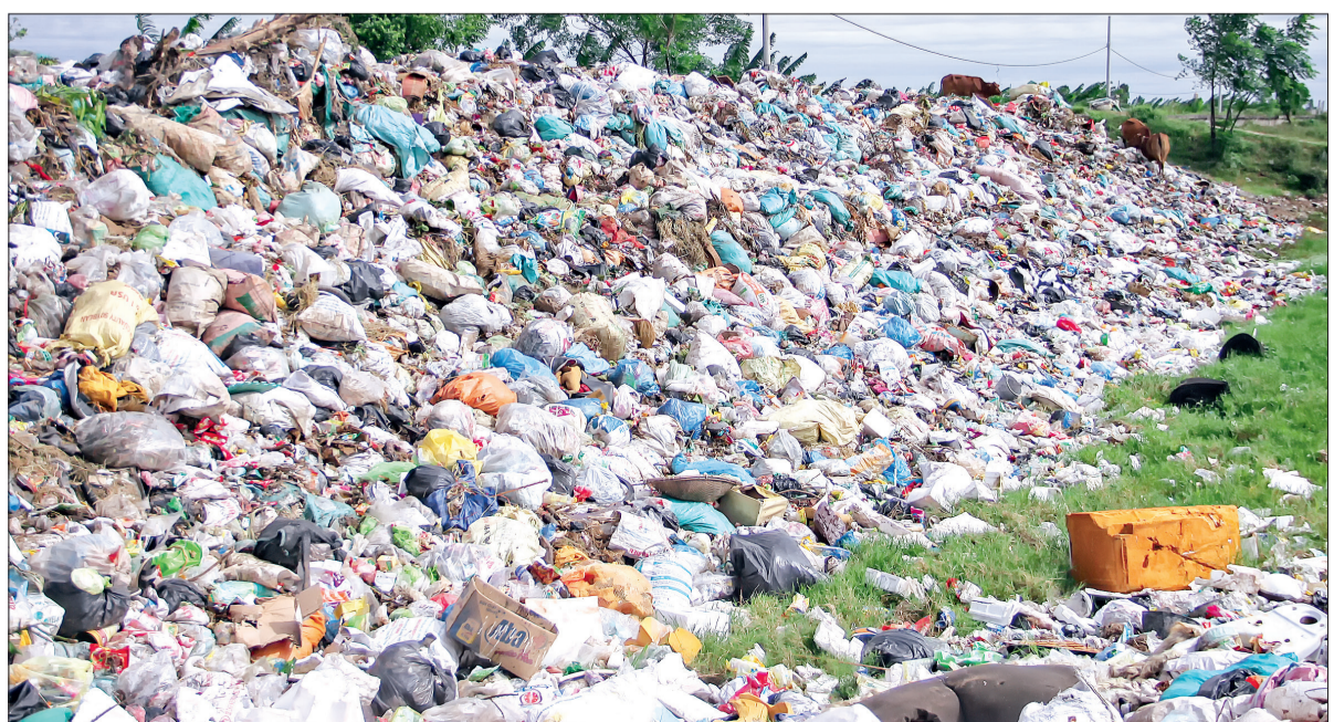
Hàng chục mét mái đê tả của sông Hồng Hà tràn ngập rác.

Hình ảnh rác thải tập kết trên mái đê tả của sông Hồng Hà do phóng viên Báo Thái Bình ghi lại.