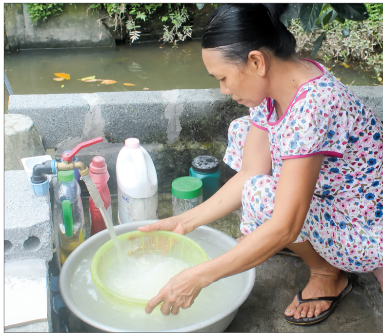
Người dân thôn Cộng Hòa, xã Đông Quang (Đông Hưng) được dùng nước sạch.