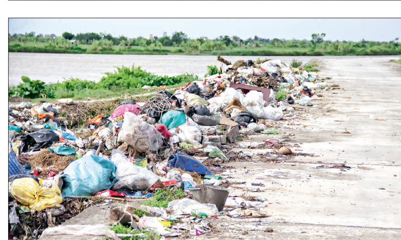
Rác thải tràn cả lên mặt đê.