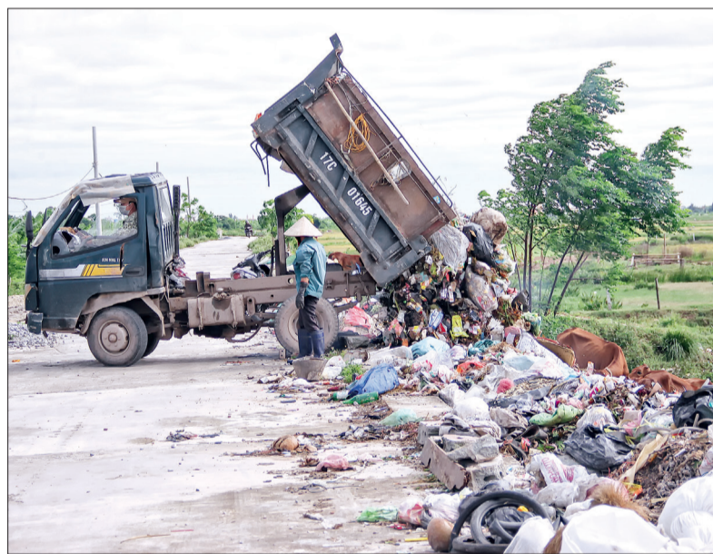
Rác thải sau thu gom được công nhân tổ vệ sinh môi trường xã đổ trực tiếp xuống mái đê tả của sông Hồng Hà.