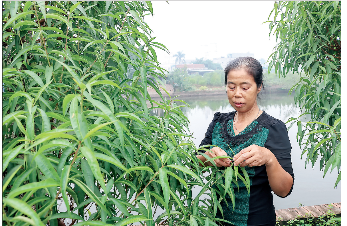
Người dân các địa phương đang bắt đầu tuốt lá đào.