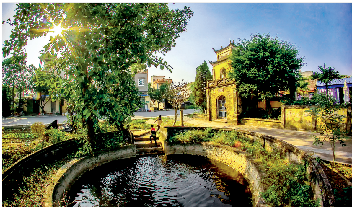
Đình để lớp trẻ quay lưng lại với di sản văn hóa (ảnh chụp chùa Vân Nam, khu Vân Nam, thị trấn Hưng Nhân, huyện Hưng Hà).