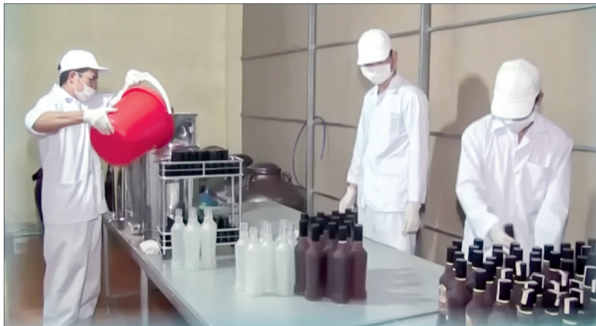
Xưởng sản xuất rượu cổ truyền thương hiệu Bình tây và Hương quê của Công ty Cổ phần Thương mại Thành Đạt.