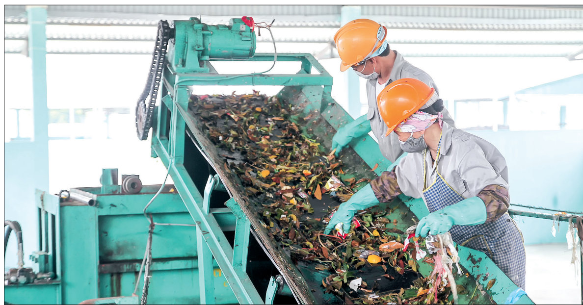
Công nhân vận hành tại nhà máy xử lý rác thải sinh hoạt thị trấn Quỳnh Côi (Quỳnh Phụ).