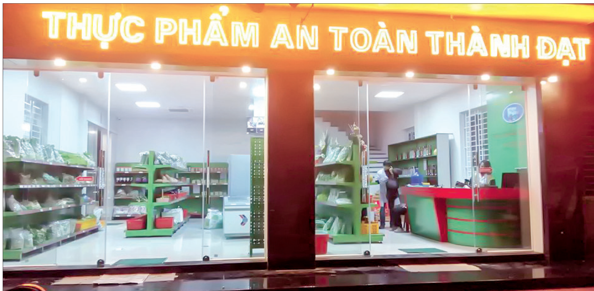
Cửa hàng thực phẩm an toàn Thành Đạt.

sinh tại phường Kỳ Bá (thành phố Thái Bình)... Tích cực tham gia đóng góp ngân sách cho nhà nước, chia sẻ lợi ích với xã hội, bảo đảm ổn định đời sống và nâng cao mức lương cơ bản cho cán bộ, công nhân viên, trở thành một công ty có uy tín được xã hội công nhận, với những giá trị nhân văn trong triết lý kinh doanh và định hướng phát triển.