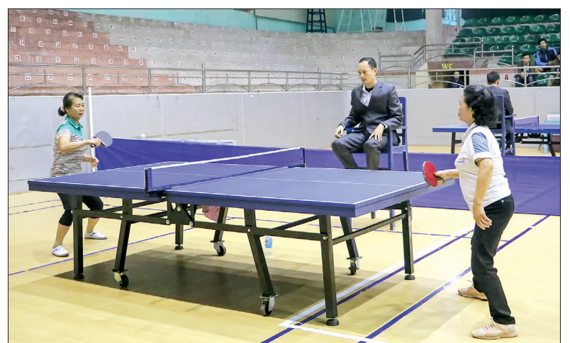
Phụ nữ tích cực tham gia luyện tập bóng bàn.