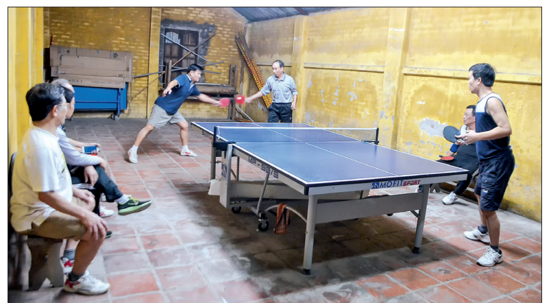
Tập luyện bóng bàn tại câu lạc bộ Lương Thế Vinh (phường Trần Hưng Đạo, thành phố Thái Bình).

ra có khoảng 100 CLB bóng bàn tự phát hoạt động tại các địa phương trong tỉnh. Tại nhiều địa phương, phong trào tập luyện bóng bàn phát triển mạnh như huyện Vũ Thư, Tiên Hải, Thái Thụy, Đông Hưng, thành phố Thái Bình. Để tiếp tục phát triển phong trào tập luyện bóng bàn, Sở Văn hóa, Thể thao và Du lịch thường xuyên tổ chức các giải bóng bàn để đánh giá chất lượng tổ chức, chất lượng chuyên môn của các vận động viên trên địa bàn tỉnh từ đó có định hướng đầu tư, phát triển phong trào trong những năm tiếp theo. Riêng giải đấu năm nay tổ chức trong hai ngày 8 - 9/12, có 100 vận động viên tham gia ở 12 đội tuyển trên địa bàn toàn tỉnh. Để bóng bàn trở thành thể mạnh của phong trào thể dục thể thao Thái Bình, lãnh đạo Sở Văn hóa, Thể thao và Du lịch đã phối hợp với Ban Chấp hành Liên đoàn Bóng bàn Thái Bình thống nhất kiện toàn Ban Chấp hành nhằm tiếp tục phát triển xây dựng tổ chức xã hội góp phần nâng cao chất lượng chuyên môn bóng bàn Thái Bình trong thời gian tiếp theo.