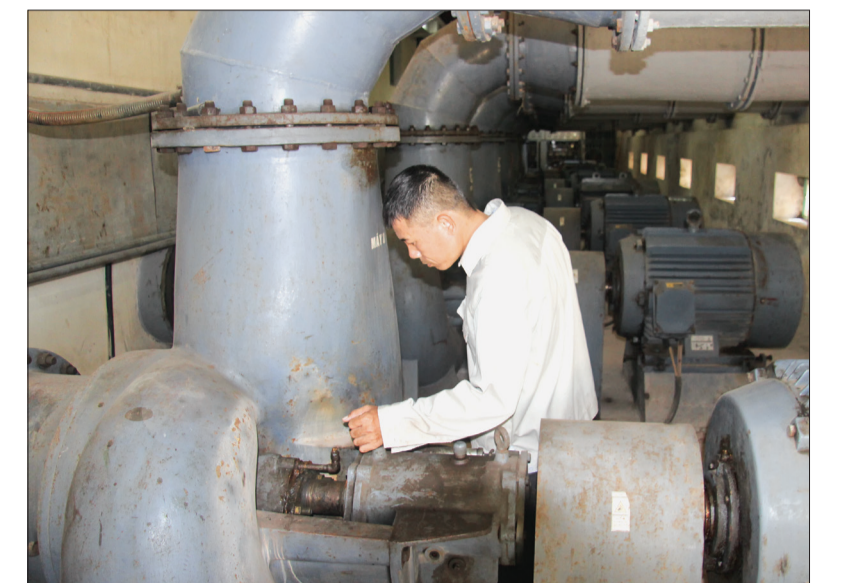
Công nhân trạm bơm Thống Nhất (Tiền Hải) kiểm tra máy bơm trước khi vận hành.