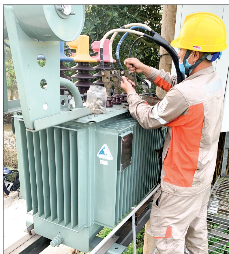
Công nhân Điện lực Đông Hưng kiểm tra, sửa chữa thiết bị điện.