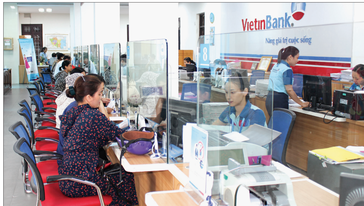
Hoạt động giao dịch ở Ngân hàng Thương mại Cổ phần Công thương Việt Nam Chi nhánh Thái Bình.

Là một trong những ngân hàng có quy mô hoạt động lớn nên từ đầu năm đến nay mặc dù chịu tác động của dịch Covid-19 nhưng Ngân hàng Thương mại Cổ phần Công thương Việt Nam (VietinBank) Chi nhánh Thái Bình vẫn đạt kết quả kinh doanh khá, từ đó càng khẳng định được uy tín và thương hiệu của mình.