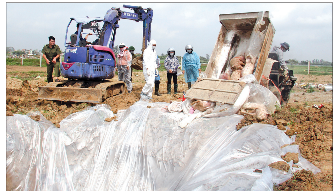
Tiêu hủy lợn bệnh theo đúng quy trình, quy định.