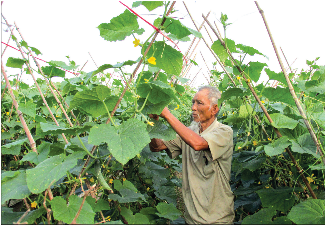
Người dân đẩy mạnh phát triển sản xuất, nâng cao thu nhập.

Dự kiến năm 2019 toàn tỉnh có 100% xã và thêm 2 huyện đạt chuẩn nông thôn mới. Thời điểm này, các địa phương đang tập trung cao nguồn lực để về đích đúng hạn.