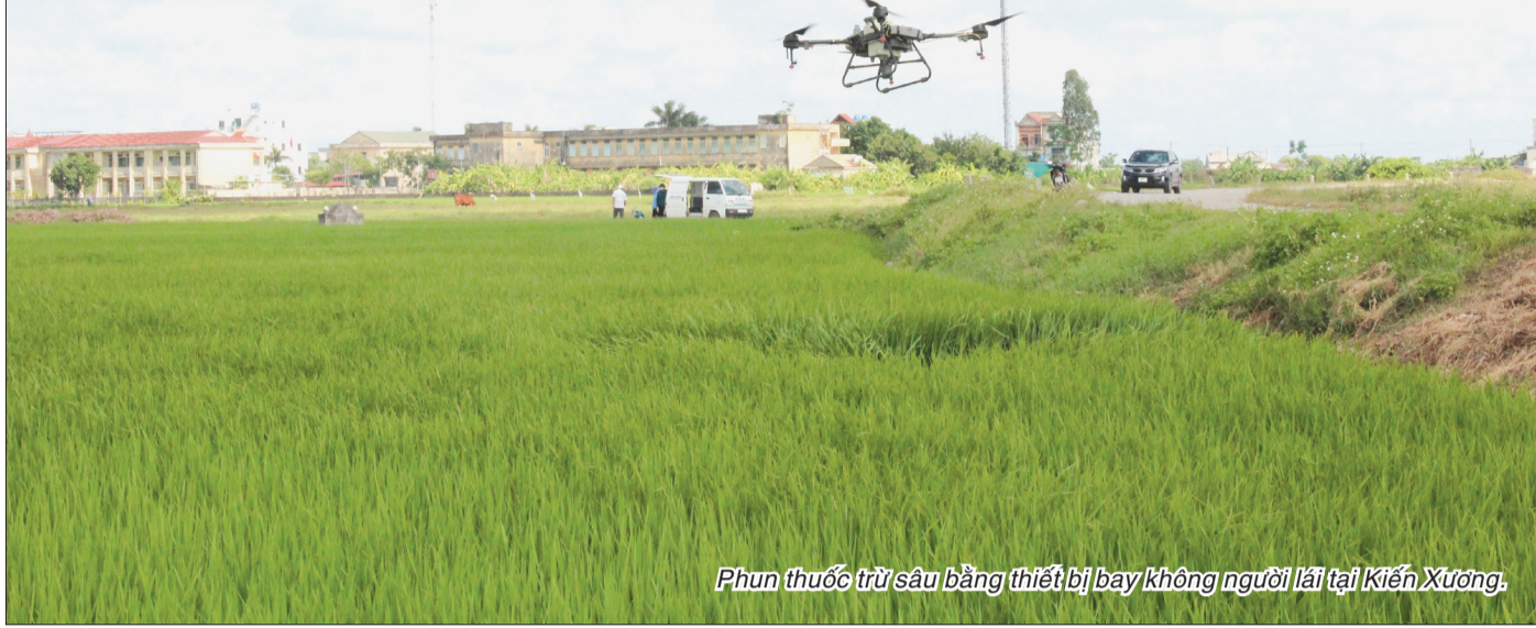
Phun thuốc trừ sâu bằng thiết bị bay không người lái tại Kiến Xương.

Với trên 90.000ha đất nông nghiệp, những năm qua Thái Bình luôn xác định tích tụ, tập trung ruộng đất là một trong những giải pháp đột phá nhằm thực hiện cơ cấu lại ngành nông nghiệp, hướng đến sản xuất quy mô lớn. Đến nay, nhiều mô hình tích tụ, tập trung ruộng đất đã được hình thành, tạo nên đổi thay căn bản cho nông nghiệp của tỉnh.