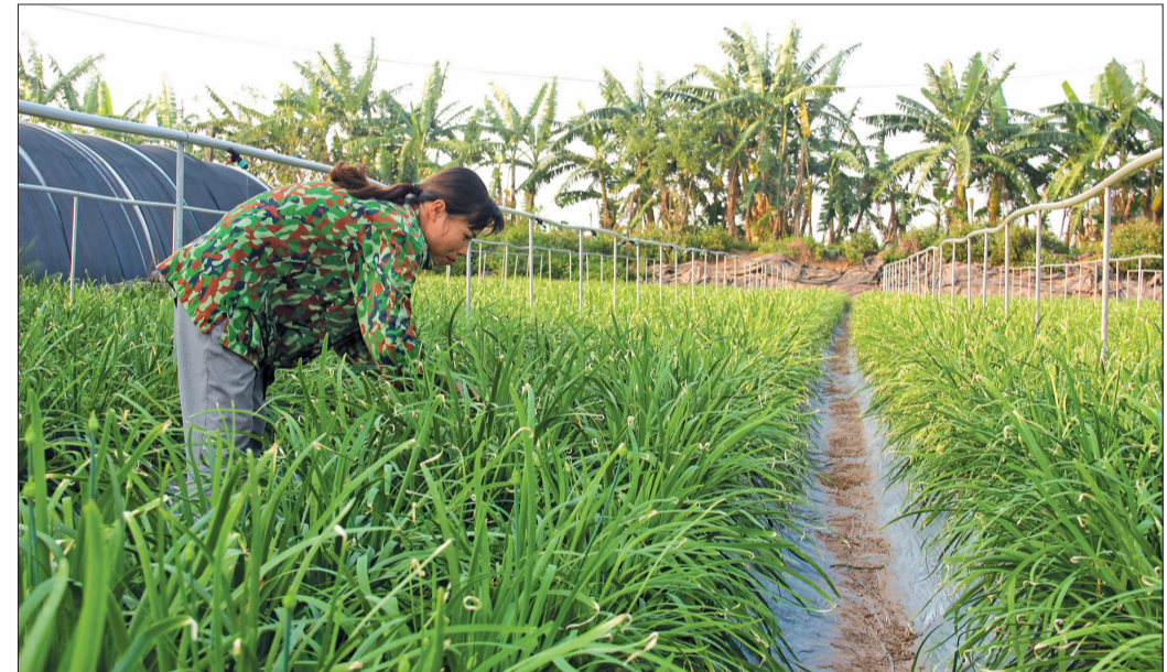
Mô hình tích tụ ruộng đất trồng hệ Đài Loan tại xã An Đông (Quỳnh Phụ) mang lại thu nhập cao gấp nhiều lần cây lúa.

Để có 20ha ruộng sản xuất quy mô lớn, tôi phải ký hợp đồng thuê mượn ruộng với hàng trăm hộ dân, tuy nhiên thời gian thuê ngắn, tính pháp lý không cao nên chúng tôi chưa mạnh dạn đầu tư vào hạ tầng đồng ruộng. Để phục vụ sản xuất, tôi đầu tư các loại máy như máy làm đất, máy cấy, máy gặt, hệ thống sấy... nhưng vẫn đang gặp khó khăn khi tiếp cận chính sách hỗ trợ kinh phí mua máy nông nghiệp. Do đó, tôi mong muốn nhà nước có chính sách hỗ trợ nhóm nông dân tâm huyết sản xuất nông nghiệp, đây là lực lượng nông cốt để bảo đảm cùng với các doanh nghiệp liên kết sản xuất, tiêu thụ nông sản theo chuỗi, xây dựng thương hiệu để nâng cao giá trị nông sản.