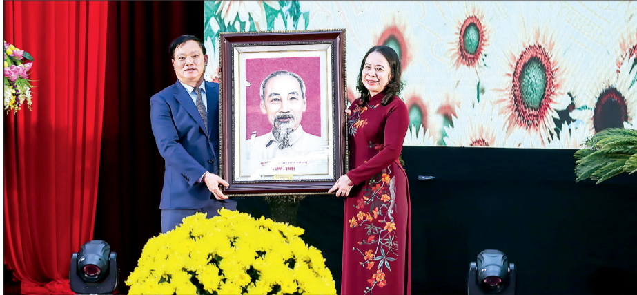
Đồng chí Võ Thị Ánh Xuân, Ủy viên Ban Chấp hành Trung ương Đảng, Phó Chủ tịch nước trao tặng Đảng bộ, chính quyền và nhân dân tỉnh Thái Bình bức chân dung Chủ tịch Hồ Chí Minh.