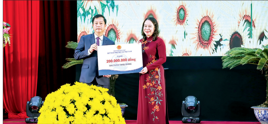
Đồng chí Võ Thị Ánh Xuân, Ủy viên Ban Chấp hành Trung ương Đảng, Phó Chủ tịch nước tặng quà trẻ em nghèo, có hoàn cảnh khó khăn thông qua Ủy ban MTTQ tỉnh.