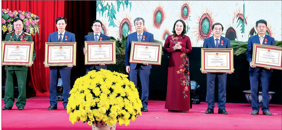
Đồng chí Võ Thị Ánh Xuân, Ủy viên Ban Chấp hành Trung ương Đảng, Phó Chủ tịch nước trao Huân chương Lao động hạng Nhất, Nhì, Ba cho các cá nhân.