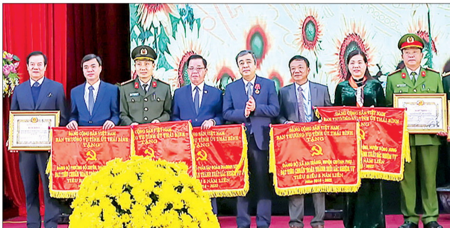
Đồng chí Ngô Đông Hải, Ủy viên Ban Chấp hành Trung ương Đảng, Bí thư Tỉnh ủy trao cờ thi đua và bằng khen của Ban Thường vụ Tỉnh ủy cho các tổ chức cơ sở đảng.