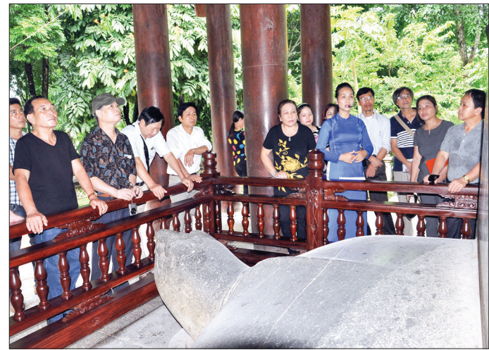
Hội viên Hội Văn học Nghệ thuật Thái Bình tham gia trại sáng tác tại Thanh Hóa.