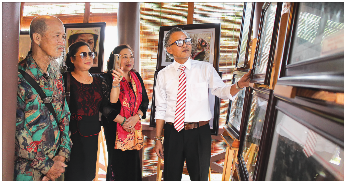
Hội viên Hội Văn học Nghệ thuật Thái Bình tổ chức triển lãm giới thiệu tác phẩm.

Cùng với công tác phát triển hội viên, công tác giáo dục chính trị tư tưởng cho hội viên cũng luôn được đặt lên hàng đầu. Trong nhiệm kỳ qua, bên cạnh sự phát hiện, tập hợp và bồi dưỡng nghiệp vụ sáng tác cho