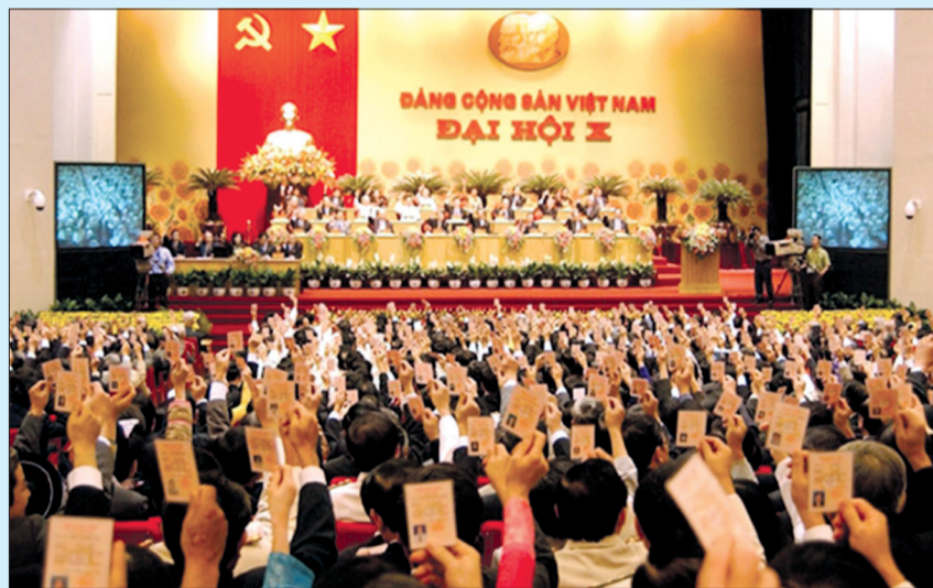
Đại hội đại biểu toàn quốc lần thứ X của Đảng diễn ra từ ngày 18 - 25/4/2006 tại Thủ đô Hà Nội.

Đại hội đại biểu toàn quốc lần thứ X của Đảng họp từ ngày 18 - 25/4/2006 tại Thủ đô Hà Nội với sự tham dự của 1.176 đại biểu đại diện cho hơn 3,1 triệu đảng viên trong toàn Đảng.