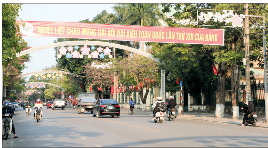
Thái Bình rực rỡ cờ hoa chào mừng Đại hội.