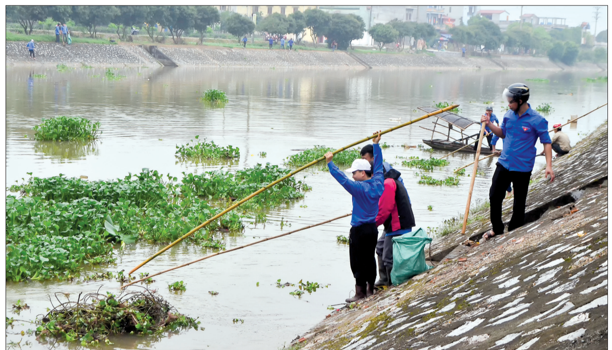
Tuổi trẻ Vũ Thư tham gia khởi thông dòng chảy.

thanh thiếu nhi tham gia. Bên cạnh đó, căn cứ đặc điểm của từng nhóm đối tượng đoàn viên, thanh thiếu nhi, các cấp bộ đoàn ngày càng chú trọng tận dụng và phát huy lợi thế của mạng internet và mạng xã hội phục vụ công tác tuyên truyền, giáo dục, tập hợp và nắm tình hình tu dưỡng thanh niên. Qua đó thể hiện tinh cảm của tuổi trẻ đối với Bác Hồ, các thế hệ cha anh đi trước; đồng thời, xác định rõ trách nhiệm của thế hệ trẻ trong công cuộc xây dựng và bảo vệ Tổ quốc.