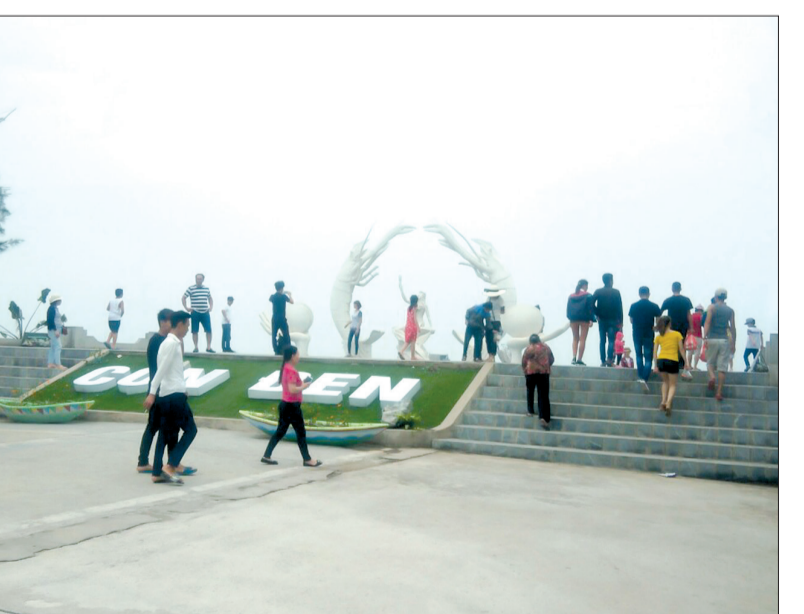
Du khách đến với khu du lịch cồn Đen (Thái Thụy).

ban quản lý đã thuê thêm người dân địa phương nhặt rác tại bờ biển đồng thời xây dựng những biển cảnh báo khu vực có nước sâu, nguy hiểm. Lực lượng xe máy nước cũng thường xuyên tuần tra, túc trực và nhắc nhở du khách bơi đúng khu vực quy định. Công tác cứu hộ kịp thời không để xảy ra tai nạn. Bên cạnh đó, chúng tôi đã phối hợp với lực lượng quản lý thị trường, công an thường xuyên kiểm tra, nhắc nhở các chủ cửa hàng ăn uống niêm yết giá công khai mỗi ngày, tránh tình trạng chèo chêm du khách. Lượng khách du lịch đến cồn Vành chủ yếu đi về trong ngày, vì thế lực lượng cảnh sát giao thông đã tổ chức phân luồng từ xa không để xảy ra ùn tắc như mọi năm.