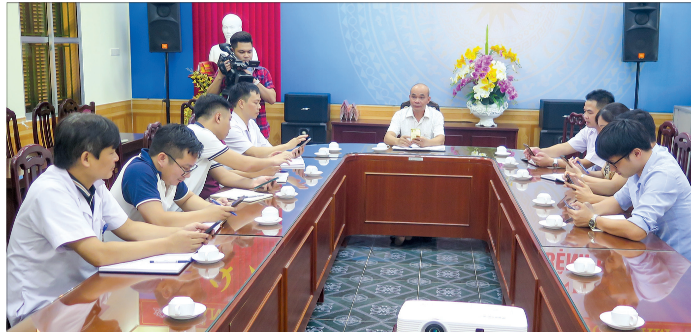
Sử dụng phần mềm "Sổ tay đảng viên điện tử" trong sinh hoạt chi bộ tại Chi bộ Khoa Phòng, chống bệnh truyền nhiễm, Trung tâm Kiểm soát bệnh tật tỉnh.