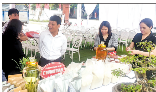
Sản phẩm OCOP của các hợp tác xã được trưng bày tại Đại hội đại biểu MTTQ huyện Quỳnh Phụ, nhiệm kỳ 2024 - 2029.

Nhằm triển khai hiệu quả chương trình mỗi xã một sản phẩm (OCOP), từ đầu năm đến nay, huyện Quỳnh Phụ tăng cường công tác tuyên truyền về tầm quan trọng của chương trình để các hợp tác xã, chủ thể tham gia, góp phần thúc đẩy kinh tế khu vực nông thôn phát triển. Theo thống kê, đến năm 2023 huyện có 22 sản phẩm được công nhận sản phẩm OCOP, trong đó có 4 sản phẩm OCOP 4 sao, 18 sản phẩm OCOP 3 sao.