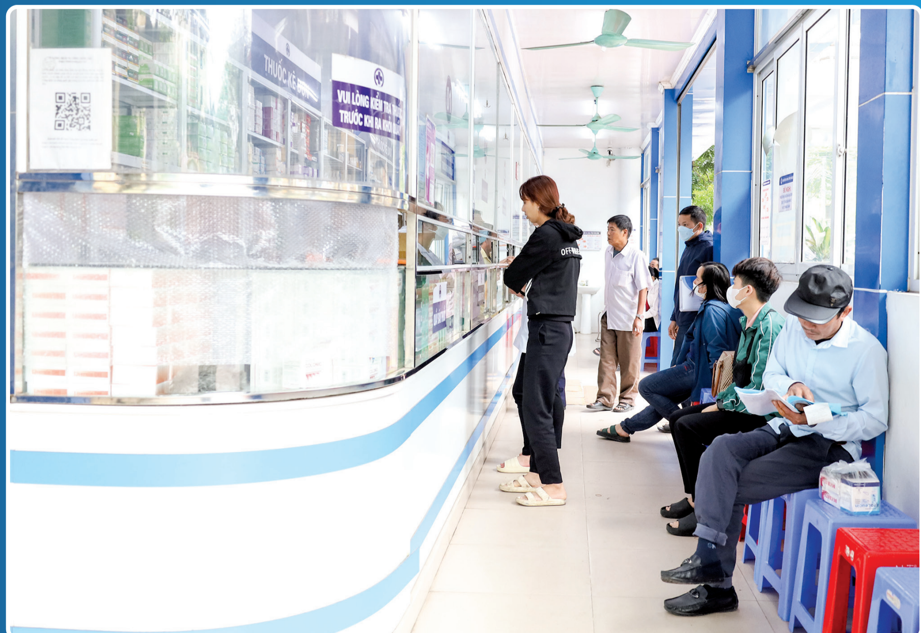
Người dân mua thuốc tại nhà thuốc Bệnh viện Đa khoa tỉnh.