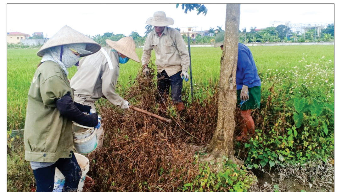
Các tổ diệt chuột của HTX DVNN Đông Hà (Đông Hưng) ra quân bắt chuột.