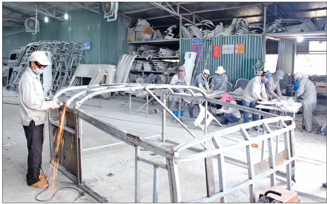
Công ty TNHH Xuân Anh Composite (xã Vũ Lễ, huyện Kiến Xương) thực hiện tốt nghĩa vụ thuế với nhà nước.

Đến hết tháng 4/2020, tổng thu ngân sách do ngành Thuế thực hiện mới chỉ đạt 1.888 tỷ đồng, đạt 27,1% dự toán Bộ Tài chính giao, bằng 91,4% so với cùng kỳ. Trừ tiền sử dụng đất, tổng thu từ thuế, phí và thu khác đạt 1.252 tỷ đồng, đạt 21,4% dự toán Bộ Tài chính giao, bằng 88,3% so với cùng kỳ. Chính vì thế để hoàn thành được dự toán năm 2020 với 6.964 tỷ đồng là cả một quá trình gian nan với rất nhiều khó khăn, thách thức đối với ngành Thuế nhất là trong giai đoạn người nộp thuế