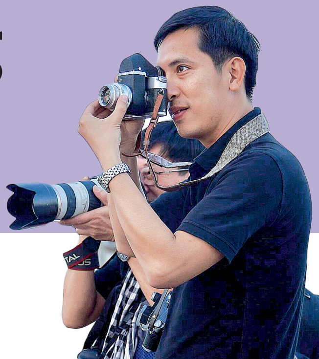
Hội viên Chi hội Nhiếp ảnh trong chuyến đi thực tế sáng tác.