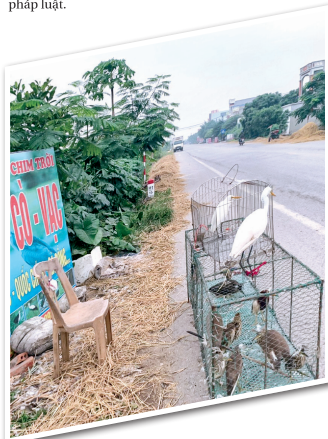
Chim tự nhiên được các tiểu thương mua lại của người dân săn bắt và được bán dọc quốc lộ 37B, qua địa bàn xã Thái Thọ (Thái Thụy).