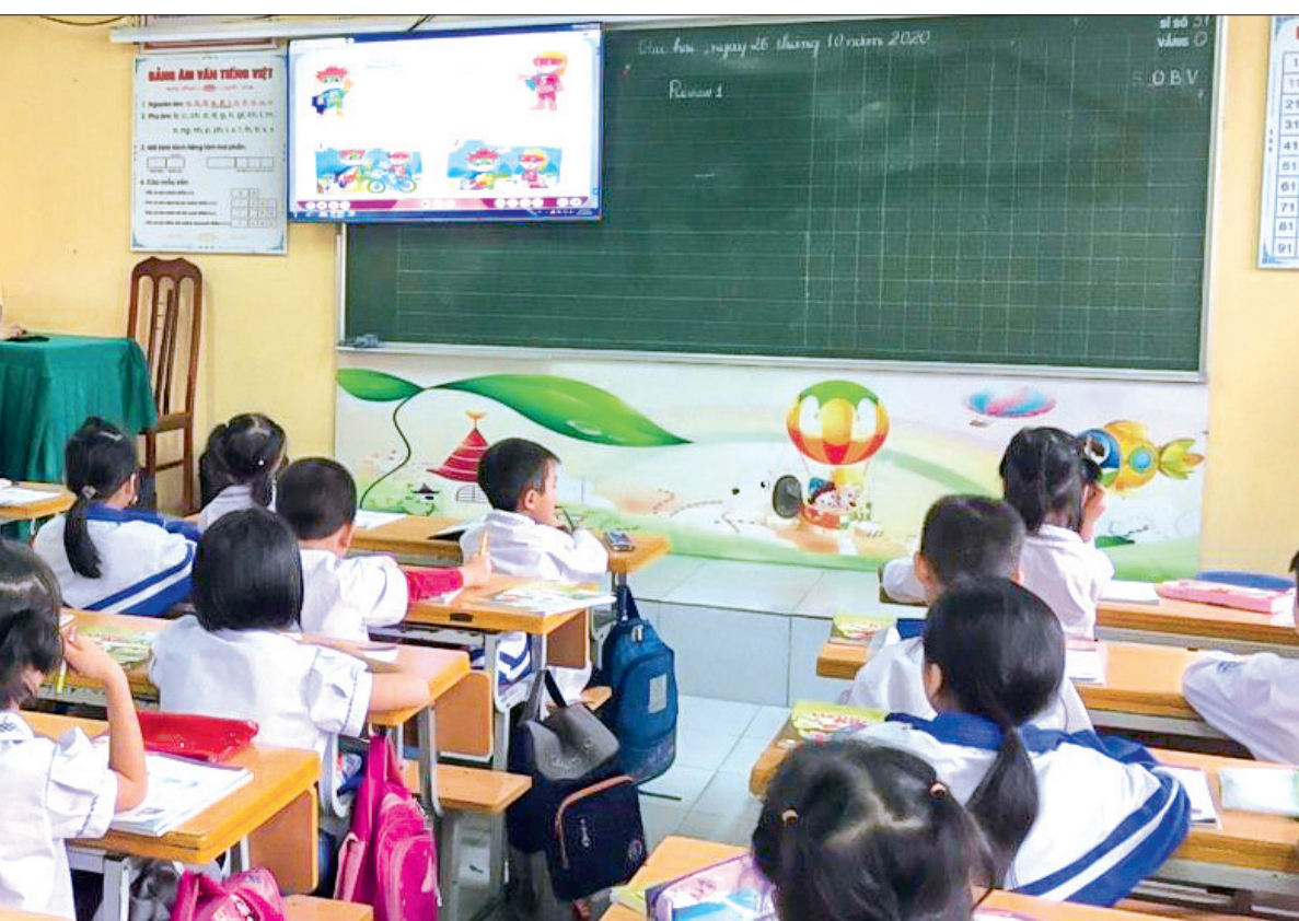
Tiết học của học sinh lớp 1 Trường Tiểu học Trung An (Vũ Thu).