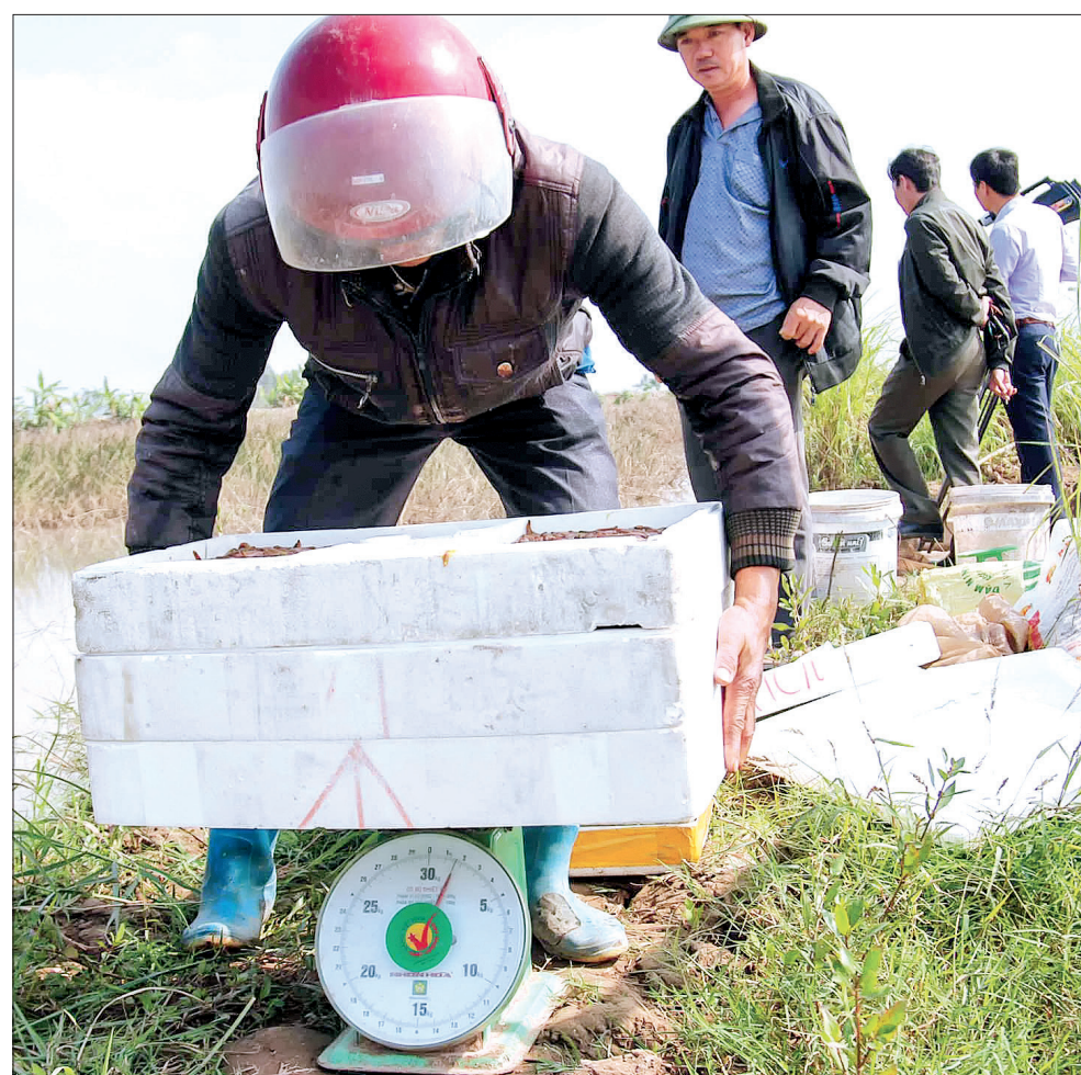
Thương lái thu mua rươi ở xã Hồng Tiến.

lúa, tuyệt đối không sử dụng phân hóa học, không sử dụng thuốc trừ sâu, thuốc trừ cỏ tránh làm ảnh hưởng đến ấu trùng rươi đang phát triển ở lớp đất phía dưới mặt ruộng lúa. Việc làm cỏ cũng như phòng, trừ sâu bệnh cho lúa được thực hiện bằng biện pháp thủ công. Đây là yếu