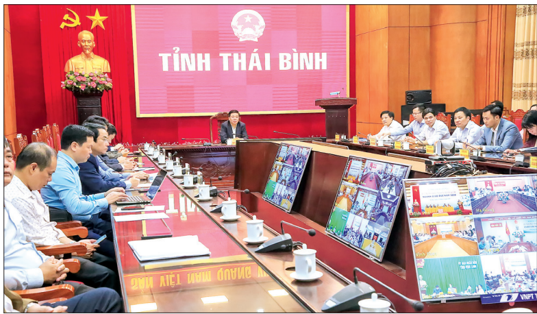
Đại biểu dự hội nghị tại điểm cầu tỉnh Thái Bình.