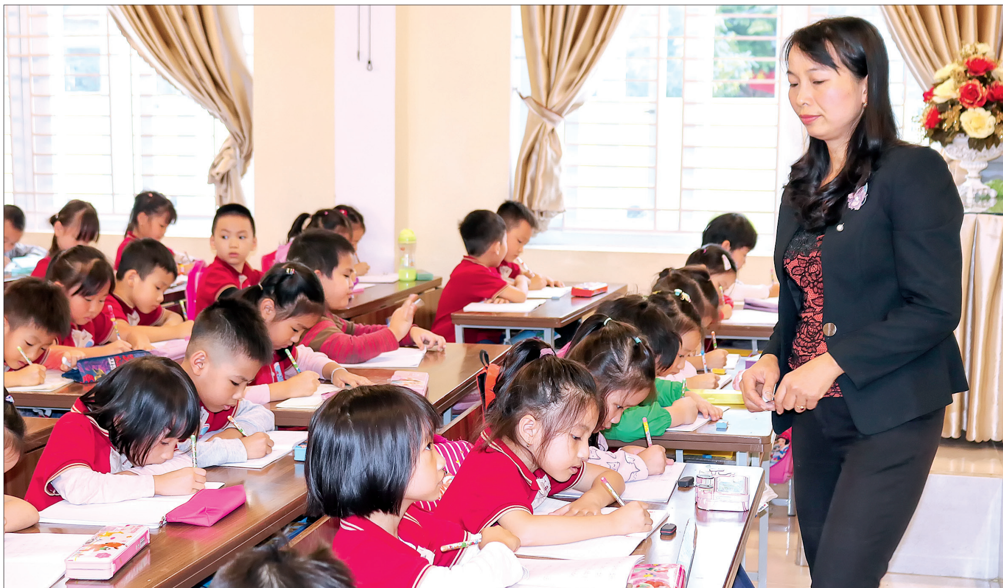
Cô và trò Trường Tiểu học Trần Hưng Đạo (thành phố Thái Bình).