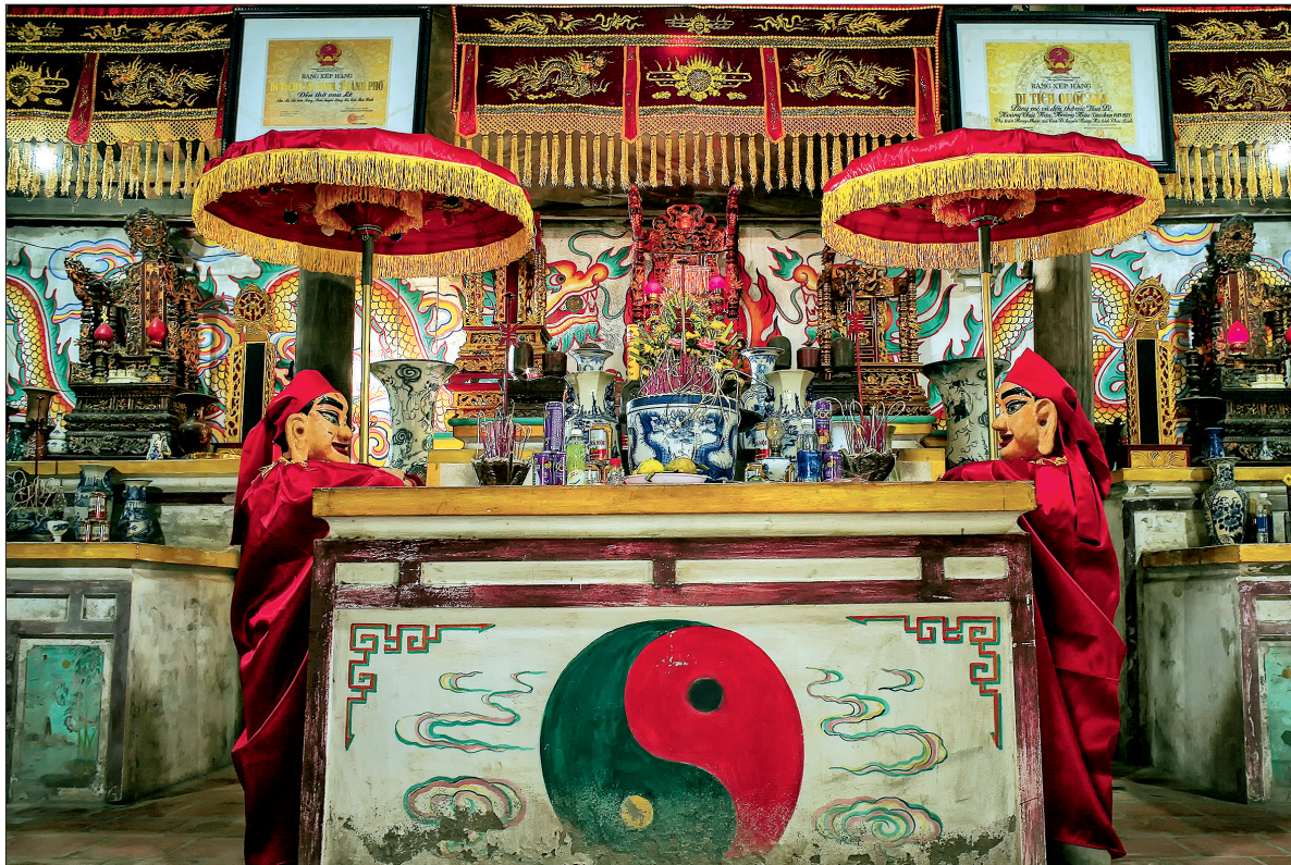
Dấu tích văn hóa Chăm trong đền thờ các vua Lê (Thuần Mỹ Điện), khu Mễ, thị trấn Hưng Nhân, huyện Hưng Hà.

Theo các nhà nghiên cứu văn hóa quân sự thời Trần, kế sách “Bình Chiêm an quốc” thực chất là “kê khai hộ khẩu và ruộng đất” để huy động sức dân vào cuộc kháng chiến, dân đinh phải nộp tiền, ruộng đất tùy loại mà nộp thuế... nắm chắc dân đinh để tuyển thêm lính và tác giả của kế sách này là Hành khiển (Đại tướng quân), Tả tham mưu quân sự Đỗ Tử Bình (1324 - 1381), người làng Tứ, tổng Cao Mỗ, huyện Thần Khê, phủ Tiên Hưng (nay là xã Hồng Việt, huyện Đông Hưng).