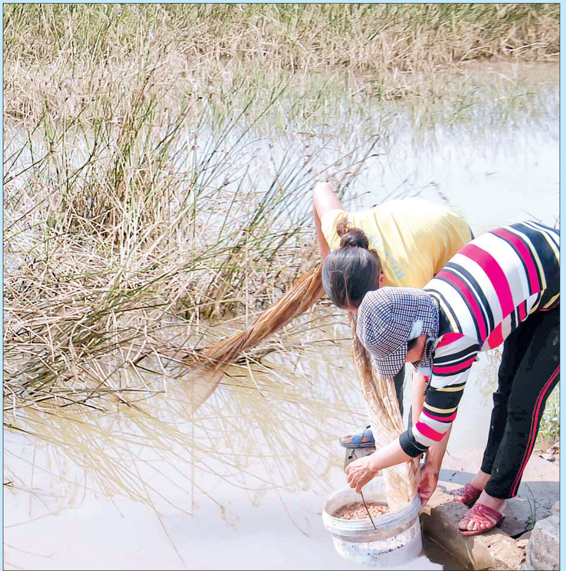
Người dân xã Hồng Tiến (Kiến Xương) khai thác rươi.