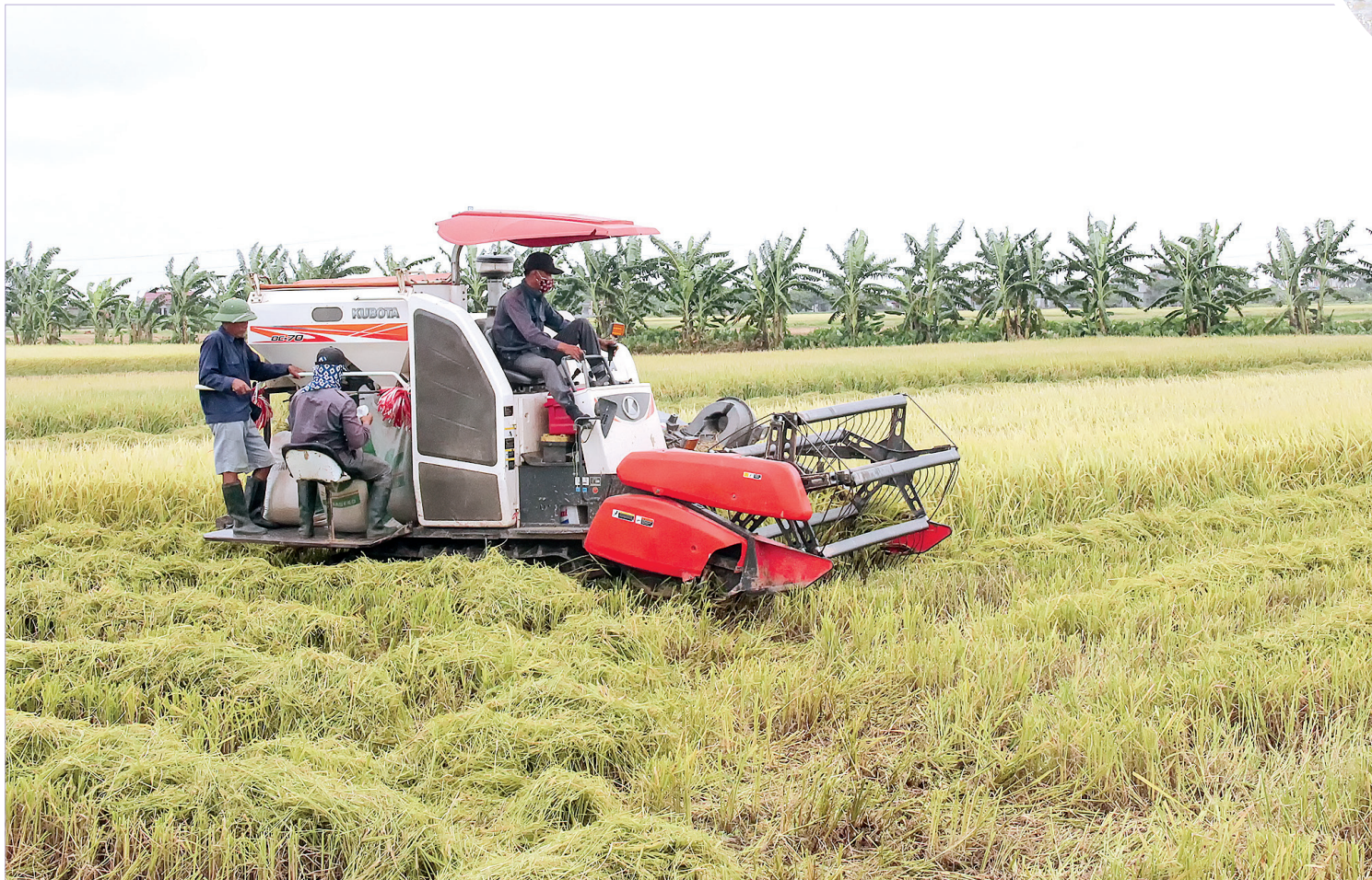
Thu hoạch lúa tại vùng khai thác rươi xã Hồng Tiến (Kiến Xương).

Xã Hồng Tiến (Kiến Xương) là địa phương có truyền thống trong nghề khai thác rươi. Đây là nguồn lợi có giá trị kinh tế rất cao đối với nông dân địa phương, cho thu nhập hàng chục triệu đồng/sào/năm. Để bảo vệ và khai thác rươi, từ xa xưa, vùng đất này đã được người nông dân giữ gìn môi trường sống của rươi. Năm 2020, nhờ sự hỗ trợ của Trung tâm Khuyến nông Thái Bình, HTX SXKD dịch vụ thủy sản xã Hồng Tiến đã thực hiện mô hình canh tác lúa hữu cơ tại vùng khai thác rươi, bước đầu mang lại những kết quả tích cực.