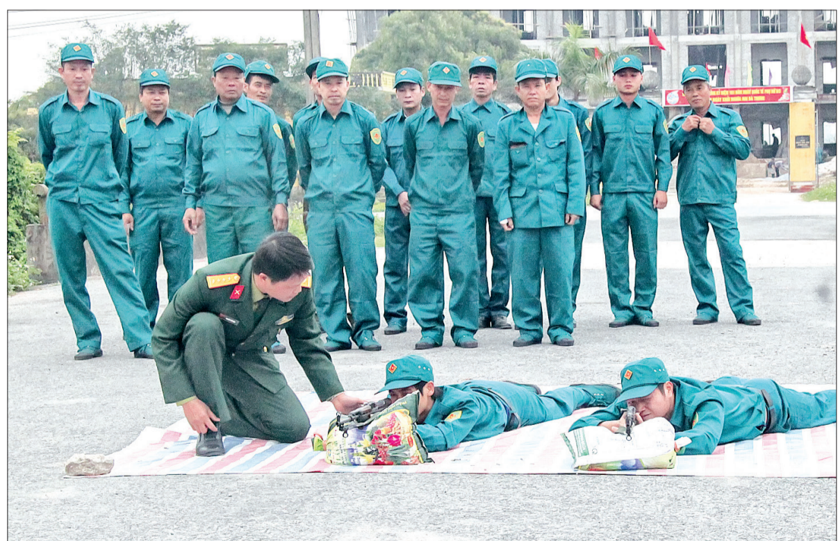
Dân quân các địa phương sôi nổi huấn luyện.

Với khí thế thi đua sôi nổi, lực lượng vũ trang (LLVT) tỉnh đang bước vào mùa huấn luyện với quyết tâm cao nhất để hoàn thành thắng lợi nhiệm vụ quân sự, quốc phòng địa phương năm 2018.