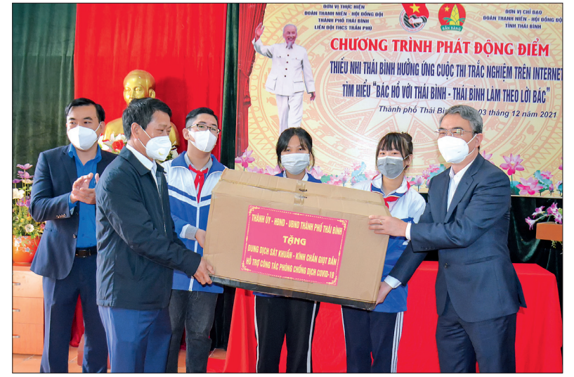
Các đồng chí lãnh đạo Ban Tuyên giáo Tỉnh ủy, thành phố Thái Bình, Tỉnh đoàn trao tặng vật tư y tế cho học sinh Trường THCS Trần Phú.