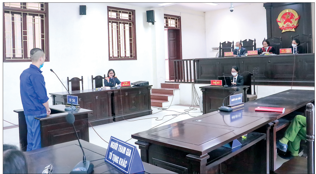
Tòa án nhân dân tỉnh xét xử vụ án cố ý gây thương tích.