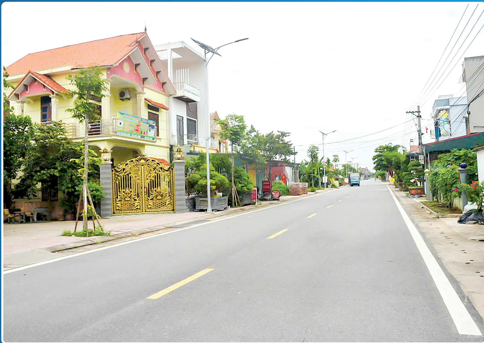
Nhờ sự đồng thuận trong hiến đất mở đường của nhân dân, hệ thống giao thông xã An Thanh (Quỳnh Phụ) khang trang, đồng bộ.