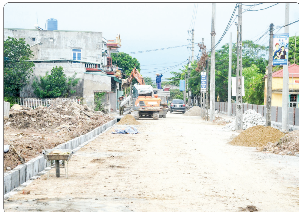
Các tổ chức, đoàn thể xã Quỳnh Hoa (Quỳnh Phụ) phối hợp trong công tác vận động nhân dân hiến đất làm đường giao thông.