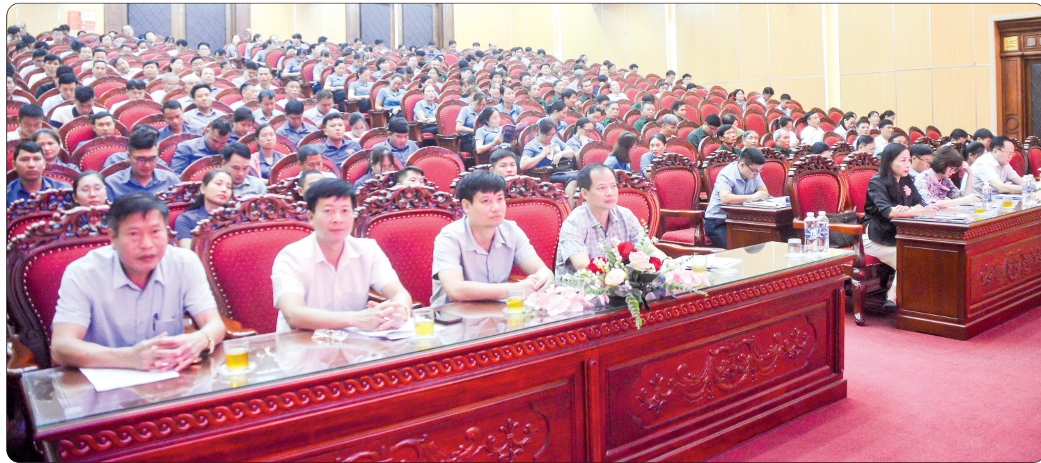
Việc tổ chức hội nghị theo nhóm ngành, lĩnh vực thể hiện sự quyết tâm của huyện Quỳnh Phụ trong công tác cải cách hành chính, giúp tiết kiệm, chống lãng phí.

Với quan điểm cắt giảm tổ chức hội họp để tiết kiệm chi phí, từ năm 2022 huyện Quỳnh Phụ có chủ trương tổ chức các hội nghị sơ kết, tổng kết theo nhóm ngành, lĩnh vực. Cách làm này được các cơ quan, đơn vị và các địa phương trong huyện nhiệt tình hưởng ứng và triển khai hiệu quả.