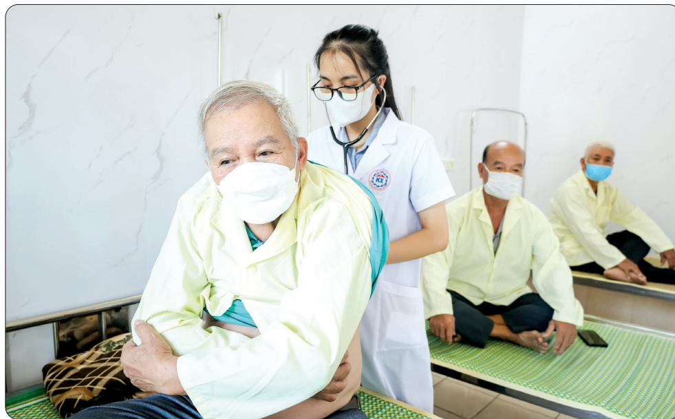
Nhiều người cao tuổi mắc viêm phế quản phải nhập viện điều trị.