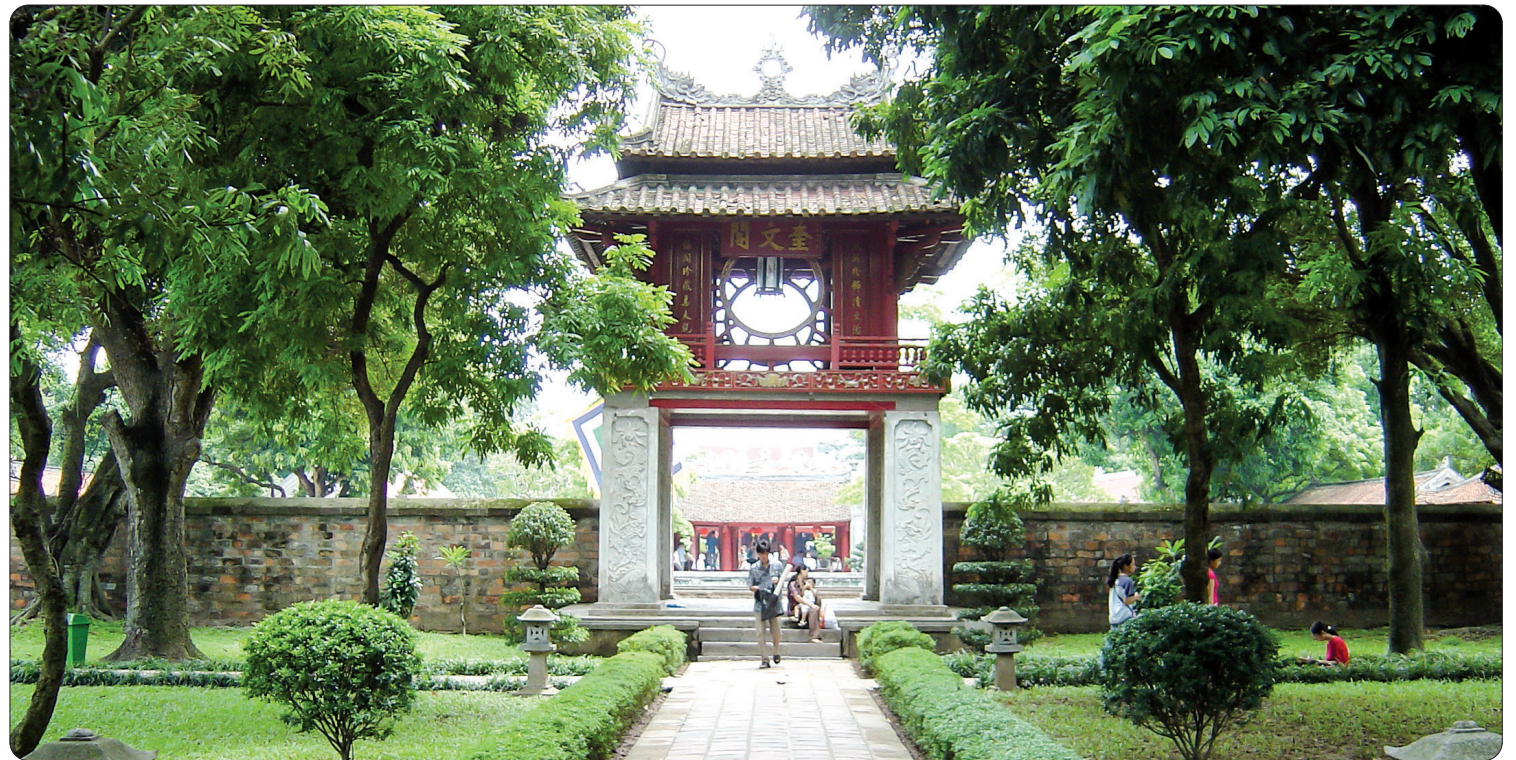
Văn Miếu - Quốc Tử Giám (Hà Nội).