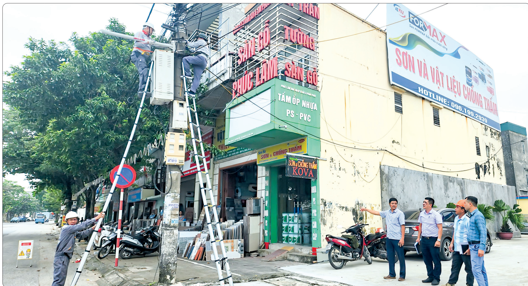
Phường Bồ Xuyên triển khai lắp đặt camera giám sát an ninh tại đường Lý Thường Kiệt.

Trong thời đại công nghệ số hiện nay, việc ứng dụng các giải pháp công nghệ để bảo vệ an ninh trật tự là một xu hướng tất yếu. Để án đầu tư lắp đặt mạng lưới vị trí camera giám sát an ninh trên địa bàn thành phố Thái Bình đã nhận được sự hưởng ứng, đóng góp tích cực từ cả cộng đồng doanh nghiệp và người dân.