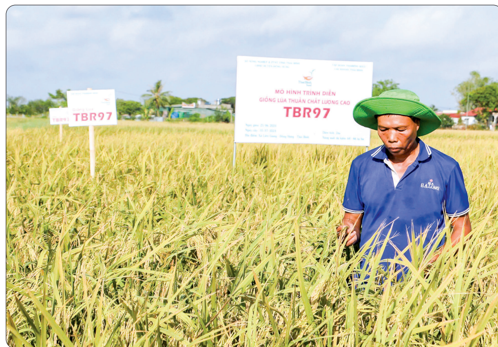
TBR97 mang lại mùa vàng cho nhiều người dân xã Liên Giang (Đông Hưng).

Không chỉ cho năng suất cao, chất lượng gạo thơm, ngon, giống lúa TBR97 của Công ty Cổ phần Tập đoàn Thai Binh Seed còn kháng sâu bệnh, chống đổ ngã vượt trội, được thử thách qua bão số 3 vừa qua.