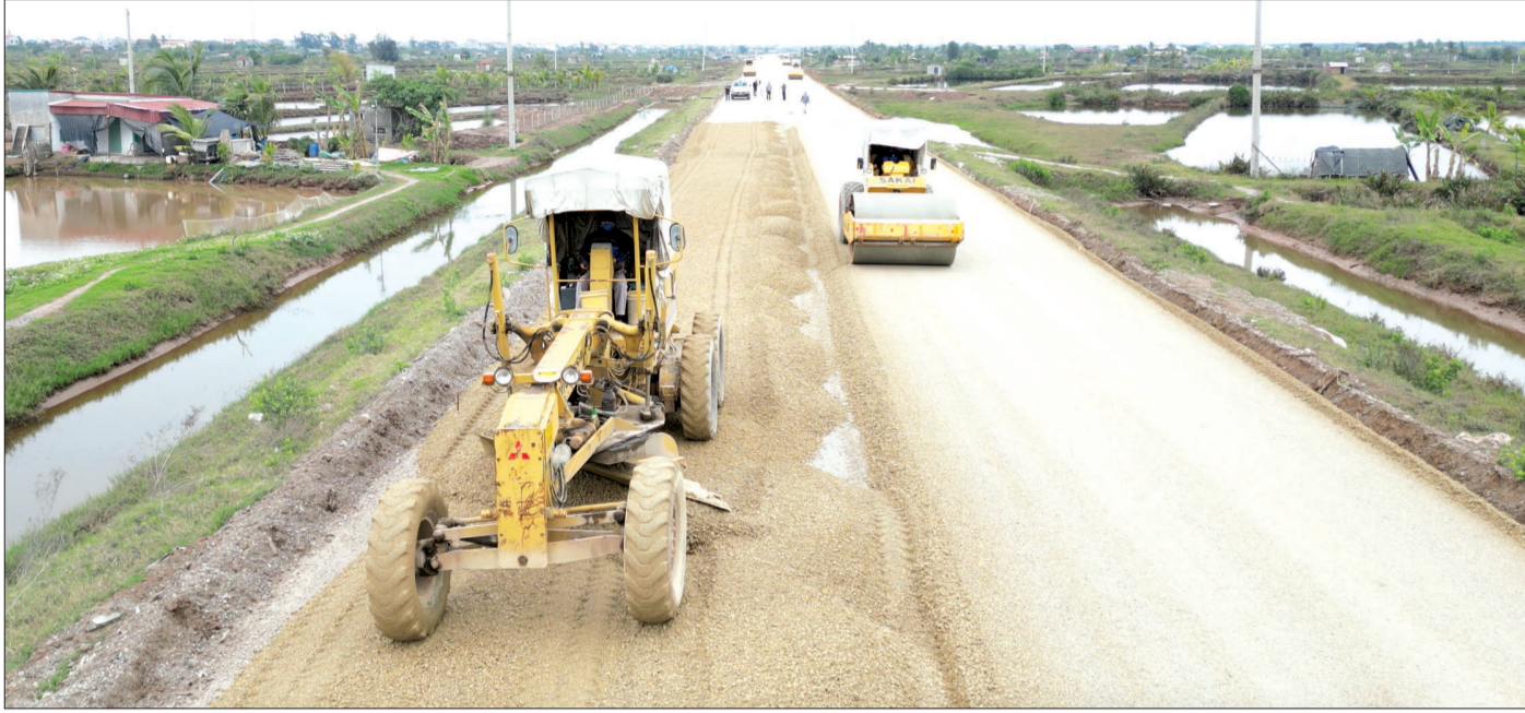
Thi công cấp phối đá dăm tuyến đường bộ ven biển đoạn qua tỉnh Thái Bình.

Dự án đầu tư xây dựng tuyến đường bộ ven biển đoạn qua tỉnh Thái Bình là công trình giao thông trọng điểm, giữ vai trò quan trọng trong phát triển kinh tế - xã hội, kết nối hạ tầng giao thông giữa Thái Bình và các tỉnh lân cận. Sau khi được Thủ tướng Chính phủ phê duyệt điều chỉnh chủ trương đầu tư, các đơn vị liên quan đã nỗ lực đẩy nhanh tiến độ thi công, quyết tâm đưa dự án về đích trong quý III/2025.