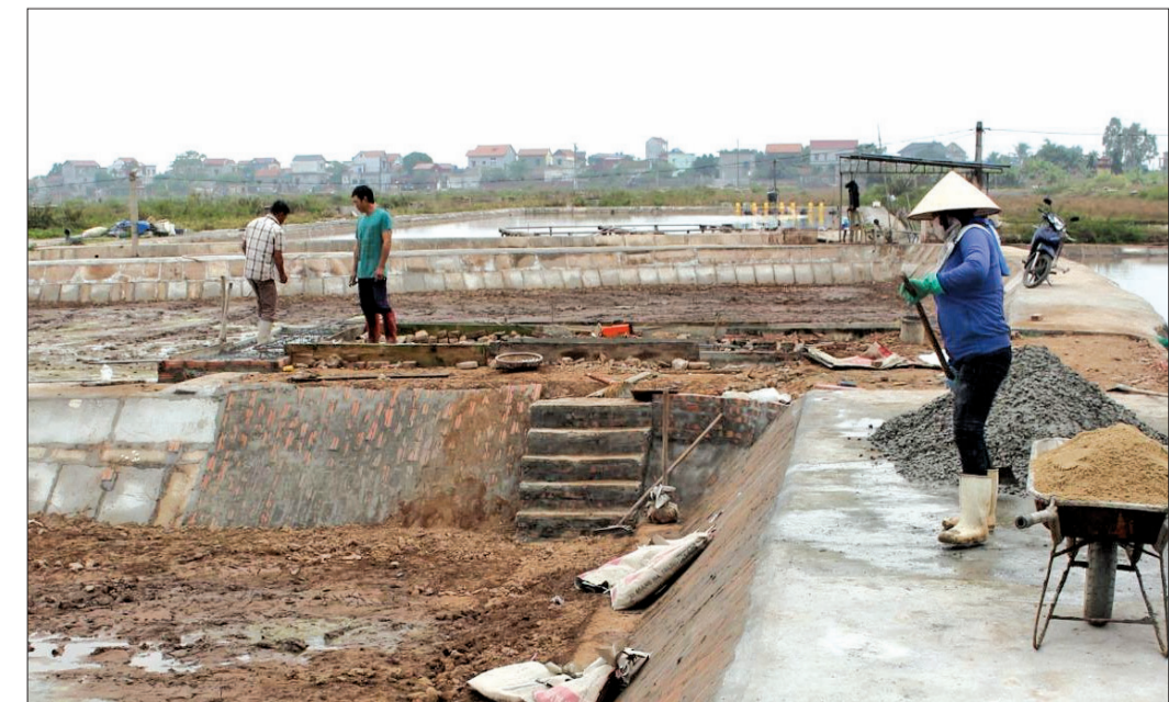
Các hộ dân xã Thụy Hải (Thái Thụy) đầu tư kinh phí xây dựng hạ tầng nuôi trồng thủy sản.