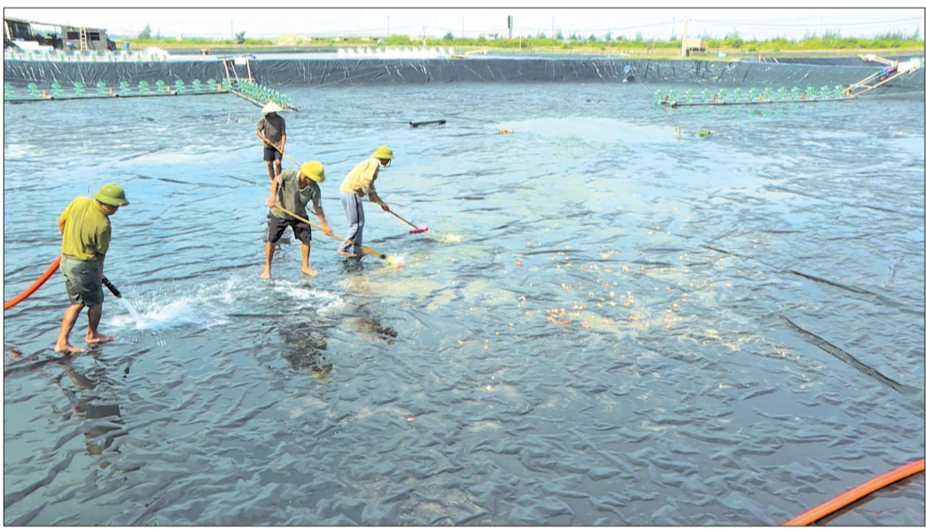
Người dân xã Đông Minh (Tiền Hải) vệ sinh ao nuôi tôm công nghệ cao.

Vụ nuôi trồng thủy sản (NTTS) vụ xuân hè năm 2025 của các xã ven biển huyện Tiền Hải thường bắt đầu sau tiết Thanh minh. Khi lịch thời vụ thả giống thủy sản năm nay đang cận kề cũng là lúc người dân hoàn tất các khâu chuẩn bị cuối cùng, sẵn sàng điều kiện tốt nhất cho vụ nuôi mới.