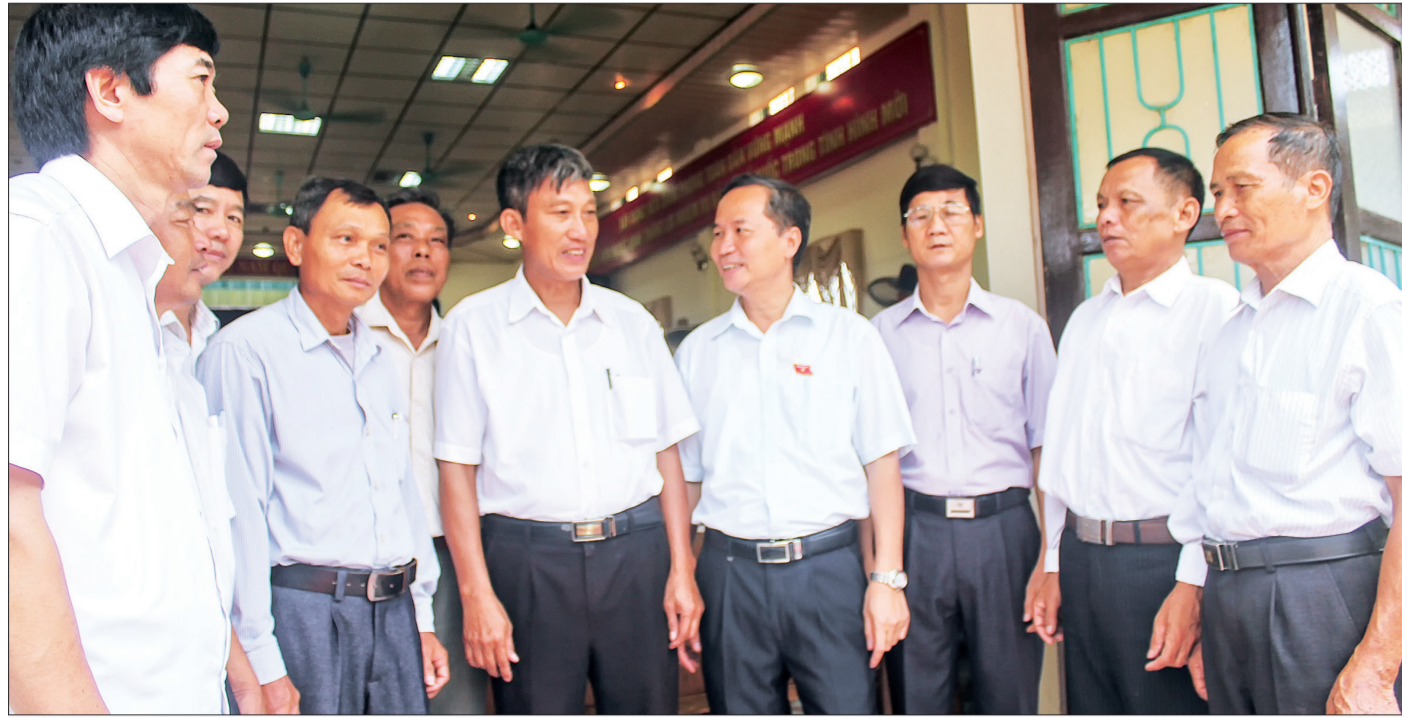
Đại biểu HDND tỉnh, HDND huyện Kiến Xương trao đổi với cử tri bên lễ hội nghệ thuật.

HDND các cấp và đại biểu HDND là nơi nhân dân trao gửi niềm tin của mình. Nửa nhiệm kỳ qua, sự trách nhiệm của cơ quan dân cử, của người đại biểu dân cử trong giải quyết những bức xúc của nhân dân đã chứng tỏ niềm tin ấy được đặt đúng chỗ.