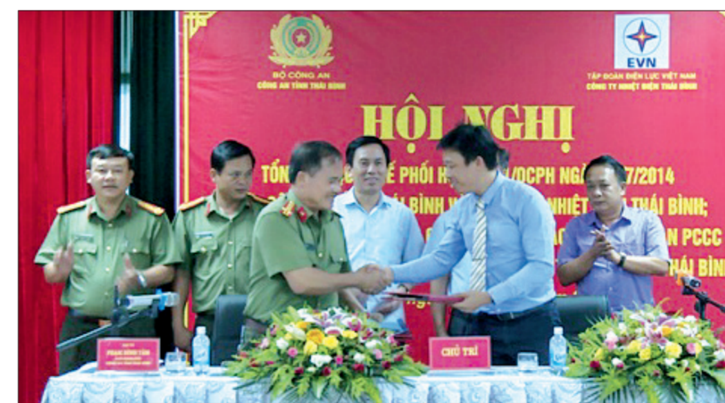
Công an tỉnh và Ban Quản lý dự án nhiệt điện Thái Bình ký kết chương trình phối hợp bảo đảm an ninh trật tự.

và trong cuộc kháng chiến chống thực dân Pháp, trong hoàn cảnh khó khăn, quân số ít, trình độ mọi mặt còn hạn chế song dưới sự lãnh đạo của Đảng, lực lượng bảo vệ chính trị đã mưu trí, dũng cảm đấu tranh trấn áp bọn phản cách mạng, phá tế, trừ gian, triệt phá nhiều tổ chức gián điệp, chính trị phản động, bảo vệ vững chắc thành quả cách mạng, góp phần vào thắng lợi của cuộc kháng chiến. Hòa bình lập lại, lực lượng ANND được kiện toàn, phát triển, tiếp tục lập nhiều chiến công. Trong đó, đã đấu tranh thắng lợi chống địch cưỡng ép đồng bào di cư vào Nam; giữ vững an ninh trật tự trong cải cách và sửa sai sau cải cách ruộng đất; phục vụ thắng lợi công cuộc khôi phục kinh tế, góp phần củng cố lòng tin của dân với Đảng. Trong cuộc kháng chiến chống Mỹ cứu nước, lực lượng ANND đã phát hiện, đấu tranh triệt