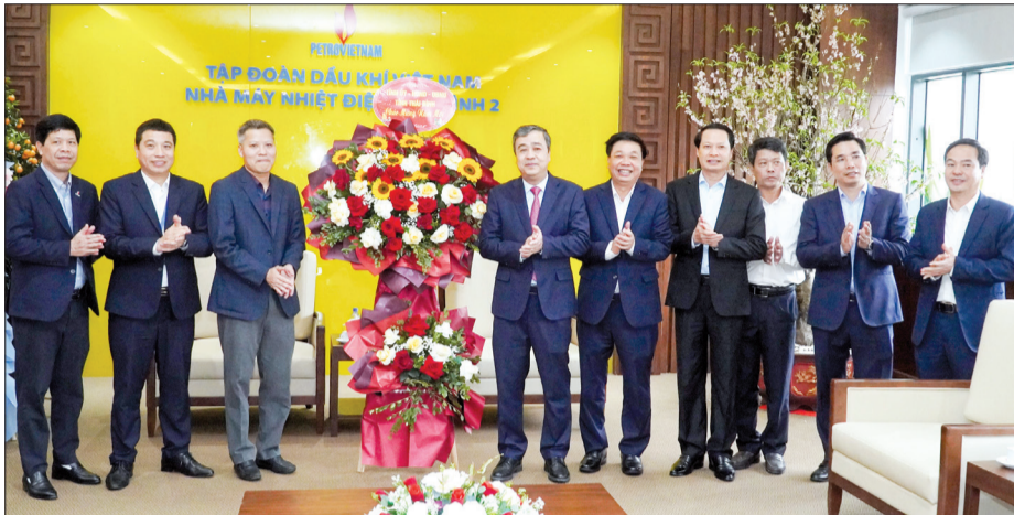
Đồng chí Ngô Đồng Hải, Ủy viên Ban Chấp hành Trung ương Đảng, Bí thư Tỉnh ủy cùng các đồng chí lãnh đạo tỉnh chúc mừng Nhà máy nhiệt điện Thái Bình 2.