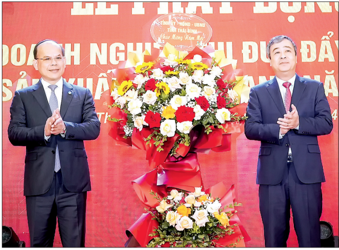
Đồng chí Ngô Đồng Hải, Ủy viên Ban Chấp hành Trung ương Đảng, Bí thư Tỉnh ủy tặng hoa chúc mừng Công ty Cổ phần Green i-Park, đơn vị đăng cai tổ chức lễ phát động.