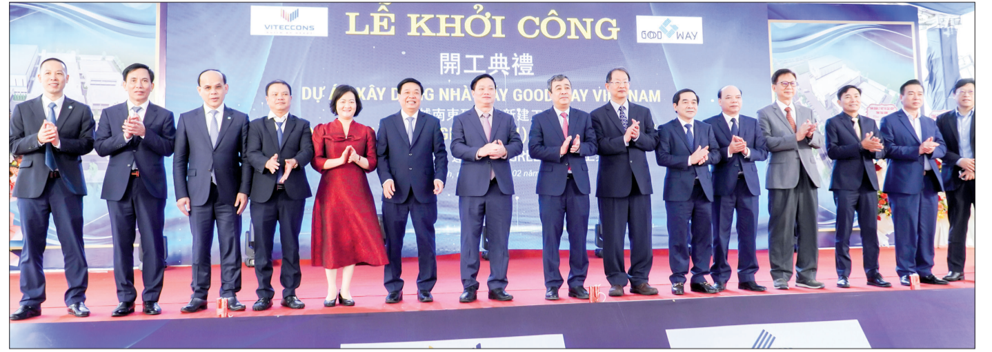
Các đồng chí lãnh đạo tỉnh và đại biểu chúc mừng Công ty TNHH Công nghiệp Good Way Việt Nam.