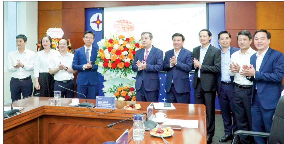
Đồng chí Ngô Đồng Hải, Ủy viên Ban Chấp hành Trung ương Đảng, Bí thư Tỉnh ủy cùng các đồng chí lãnh đạo tỉnh chúc mừng Công ty Nhiệt điện Thái Bình.