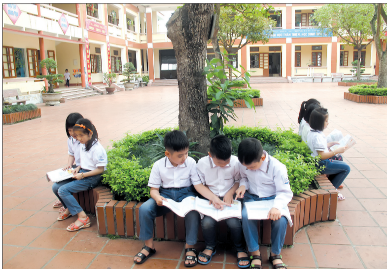
Các em học sinh tích cực ôn tập chuẩn bị cho kỳ kiểm tra cuối năm học.