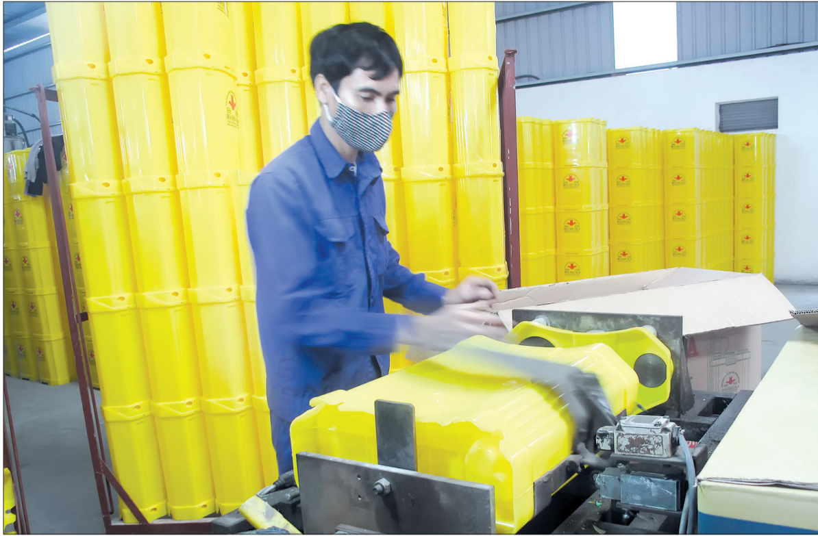
Trong ảnh: Công nhân Công ty TNHH Phát triển công nghiệp Hải Hưng (Vũ Thu) lắp ráp bình phun thuốc trừ sâu.

Để tạo chuyển biến tích cực trong cải cách TTHC, Sở Nông nghiệp và Phát triển nông thôn đã thực hiện nghiêm việc đánh giá tác động TTHC và thẩm định chặt chẽ các TTHC trong các lĩnh vực thuộc thẩm quyền giải quyết của ngành để tham mưu kịp thời với UBND tỉnh ban hành danh mục TTHC lĩnh vực nông nghiệp và phát triển nông thôn được chuẩn hóa gồm 118 TTHC, trong đó 108 TTHC thuộc thẩm quyền giải quyết cấp tỉnh, 6 TTHC thuộc thẩm quyền giải quyết cấp huyện, 4 TTHC thuộc thẩm quyền giải quyết cấp xã. Công bố công khai, kịp thời các TTHC mới được ban hành, sửa đổi, bổ sung, đồng thời chủ động rà soát, loại bỏ các quy định, thủ tục không còn phù hợp, gây cản trở hoạt động sản xuất, kinh doanh và đời sống của người dân. Vừa qua, đã có 4 TTHC lĩnh vực nông thôn mới được bãi bỏ (trong đó có 3 TTHC thuộc thẩm quyền giải quyết của Sở, 1 TTHC thuộc thẩm quyền giải quyết của UBND huyện, thành phố). Sở thường xuyên rà soát, đơn giản hóa