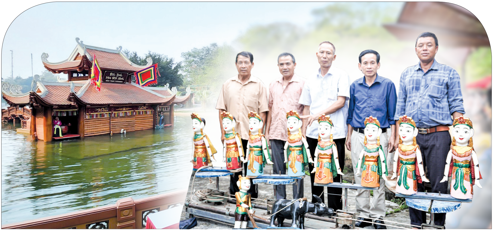
Các nghệ nhân phường rối nước Nguyễn Xá (Đông Hưng).