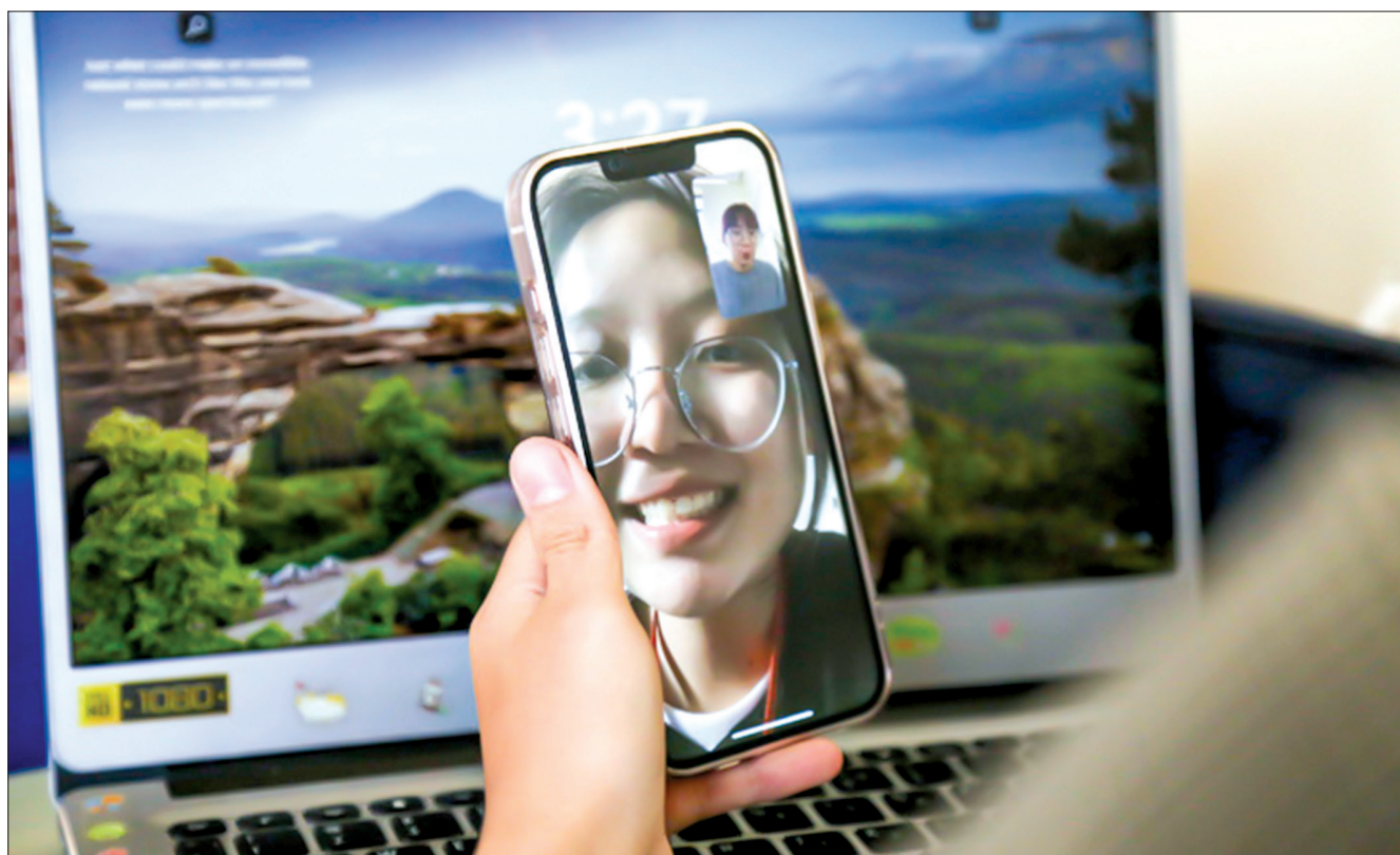
Với sự trợ giúp của công nghệ, những cuộc gọi video hoàn toàn có thể bị giả mạo.

(tuoitre.vn) Với công nghệ trí tuệ nhân tạo (AI), những kẻ lừa đảo dễ dàng thực hiện cuộc gọi video với hình ảnh và cả giọng nói y chang “chính chủ” khiến người nhận dễ dàng sập bẫy. Trước những cuộc gọi video “giả như thật” đó, cách phân biệt nên như thế nào, công nghệ nào được sử dụng, nên tập trung vào đâu để tránh bị lừa?