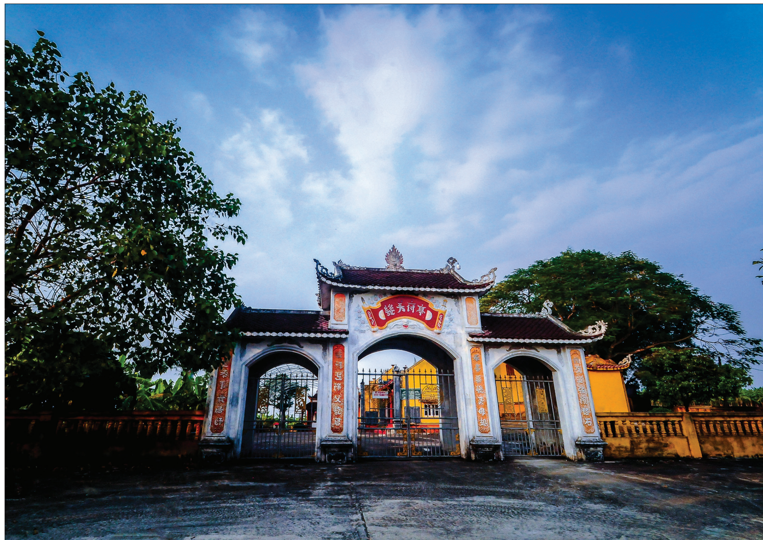
Đền Mỹ Bồng, xã Việt Hùng (Vũ Thư) - di tích lịch sử văn hóa thờ vua Hùng, vùng đất được xác định hình thành sớm, cách ngày nay khoảng gần 2500 năm.

Các tài liệu khảo cổ học chỉ ra rằng: Là một tỉnh thuần nông không có đồi núi, khá bằng phẳng, đất đai Thái Bình thuộc các huyện Hưng Hà, Quỳnh Phụ và phần lớn đất đai thuộc các huyện Tiên Hưng (nay là Đông Hưng), Thư Trì (nay là Vũ Thư), Thụy Anh (nay là Thái Thụy) có lịch sử từ 3000 - 2000 năm. Hầu hết đất đai các huyện Vũ Tiên (nay thuộc Vũ Thư), Đông Quan (Đông Hưng), Thái Ninh (Thái Thụy) có lịch sử 2000 - 1000 năm. Vùng Nam Kiến Xương, Tiền Hải và một phần Thái Thụy có lịch sử từ 1000 năm trở lại đây theo xu hướng đất sa bồi muộn dần.