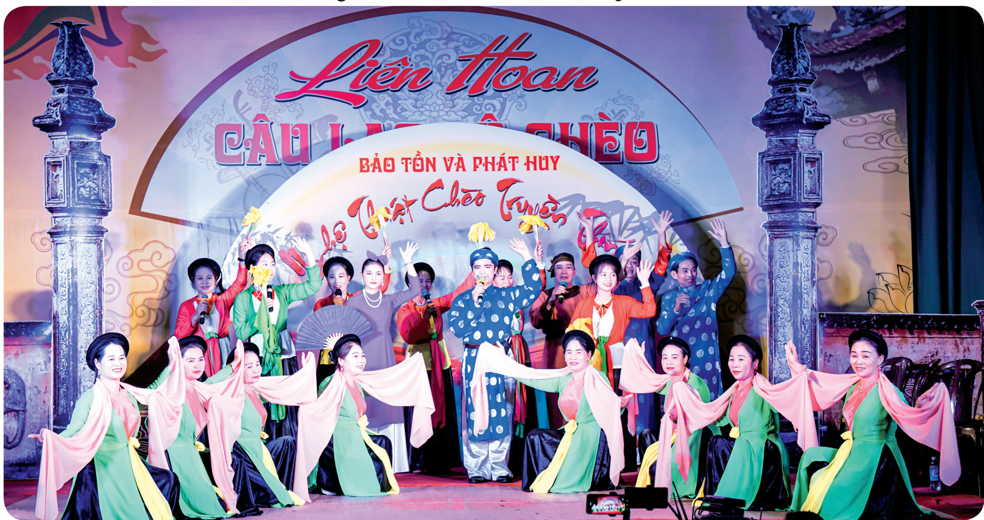
Liên hoan câu lạc bộ chèo tỉnh Thái Bình là cơ hội để người yêu chèo được thể hiện niềm đam mê với loại hình nghệ thuật dân gian độc đáo.