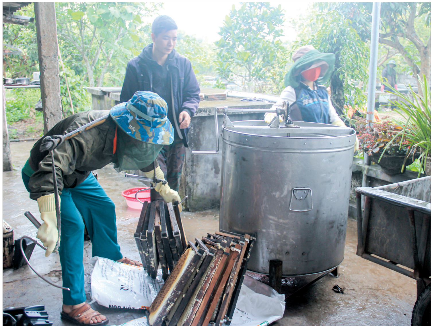
Năm nay, thời tiết thuận lợi, nhãn sai hoa, người nuôi ong thu được mật nhiều hơn.

Theo số liệu thống kê của ngành nông nghiệp, toàn tỉnh có khoảng trên 8.000 đàn ong (tính cả đàn ong của người dân trong tỉnh và số lượng đàn ong hàng năm từ các địa phương khác gửi đến vào mùa hoa), chủ yếu tập trung tại các huyện: Thái Thụy, Tiền Hải và Hưng Hà. Thái Bình có thành phần cây nguồn mật, phần khá đa dạng, với diện tích rừng ngập mặn khoảng 4.000ha (sú, vẹt, trang) mùa hoa nở khoảng tháng 4 đến tháng 8; mùa hoa nhãn, hoa vải từ tháng 2 đến tháng 3. Ngoài ra, còn có các loại cây lương thực là nguồn cung cấp phấn hoa như lúa, ngô, khoai lang và nhiều cây trồng đa dạng khác có tiềm năng nhân rộng và phát triển nghề nuôi ong.