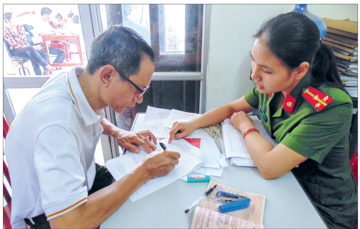
Hướng dẫn người dân thủ tục làm căn cước công dân.

Trung tá Nguyễn Tiến Dũng, Phó Trưởng Công an thành phố cho biết: Xác định thành phố là địa bàn trung tâm, là nơi đứng chân của nhiều cơ quan của tỉnh và thành phố, thường xuyên diễn ra các sự kiện lớn về chính trị, kinh tế, văn hóa - xã hội của tỉnh, do đó tình hình an ninh luôn tiềm ẩn nhiều yếu tố phức tạp. Để nắm chắc tình hình ANTT trên địa bàn, Công an thành phố đã xây dựng và triển khai thực hiện có hiệu quả phương án bảo vệ các mục tiêu trọng điểm về chính trị, kinh tế, văn hóa, an ninh, quốc phòng, các sự kiện chính trị quan trọng của đất nước, của địa phương; không để xảy ra bị động, bất ngờ. Tăng cường công tác bảo vệ an ninh kinh tế, nắm chắc tình hình hoạt động của các doanh nghiệp, chủ động phát hiện những mâu thuẫn nảy sinh tạo điều kiện cho các doanh nghiệp ổn định sản xuất, kinh doanh. Chủ động nắm chắc diễn biến tình hình an ninh nông thôn, an ninh đô thị, nhất là những vấn đề mới phát sinh trong thực hiện các chương trình phát triển kinh tế - xã hội, đến bù giải phóng mặt bằng, cưỡng chế thu hồi đất thuộc phường Trần Lãm, Tiến Phong, xã Vũ Chính, Vũ Phúc, Phú Xuân... để xuất phương án giải