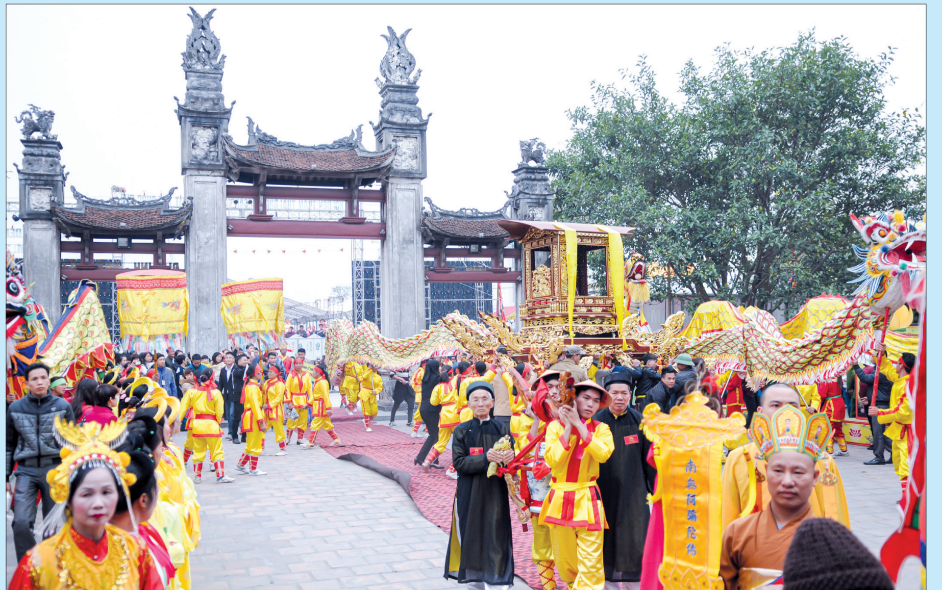
Lễ hội đền Trần độc đáo với lễ rước bộ.