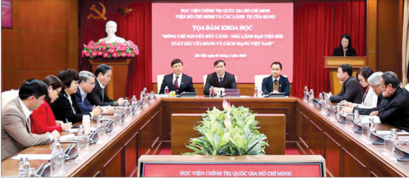
Toàn cảnh tọa đàm.