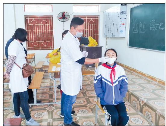
Nhân viên y tế lấy mẫu xét nghiệm sàng lọc SARS-CoV-2 ngẫu nhiên.

Sáng ngày 1/2, Trung tâm Kiểm soát bệnh tật tỉnh phối hợp với Trung tâm Y tế huyện Vũ Thư, trạm y tế các xã: Tự Tân, Hòa Bình (Vũ Thư) tổ chức giám sát trọng điểm dịch Covid-19 trong cộng đồng.