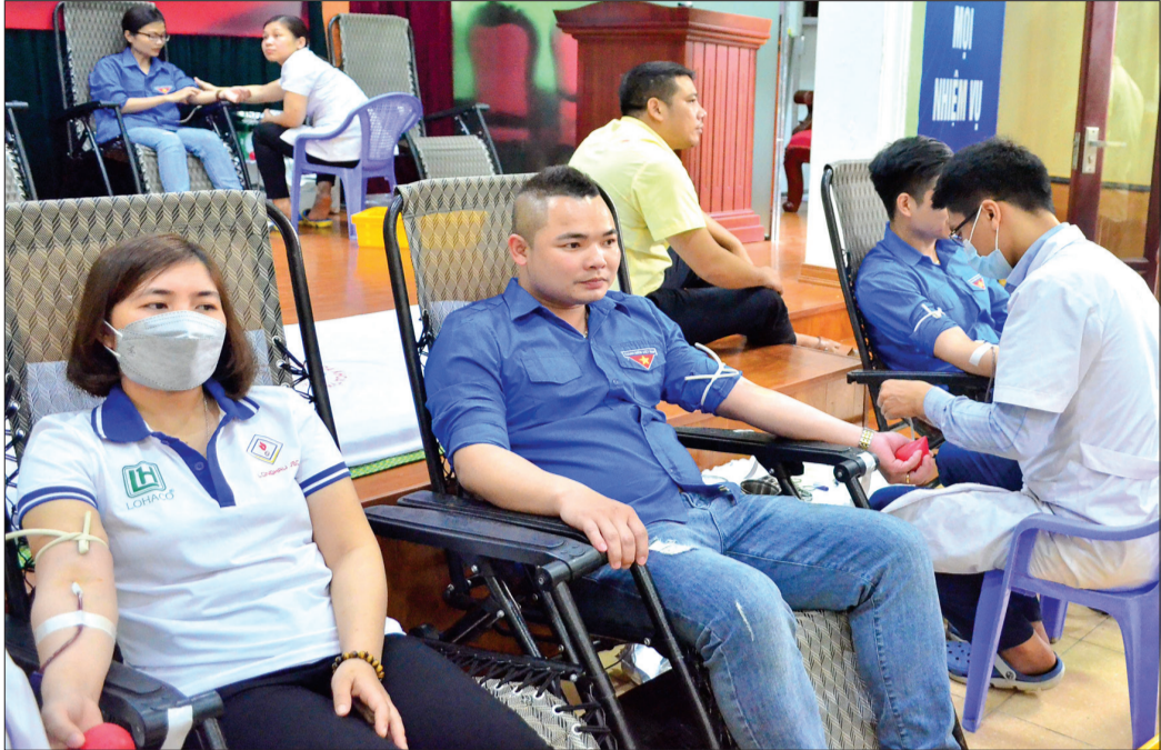
Đoàn viên, thanh niên khối doanh nghiệp tình nguyện tham gia hiến máu tình nguyện.

Phát huy vai trò xung kích, tình nguyện vì cuộc sống cộng đồng, vì an sinh xã hội, những năm qua, tuổi trẻ thành phố Thái Bình đã tạo dấu ấn đẹp trong cấp ủy, chính quyền và nhân dân với những công trình, phần việc cụ thể, thiết thực, góp phần xây dựng thành phố Thái Bình ngày càng văn minh, hiện đại.