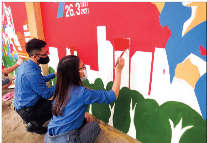
Đoàn viên, thanh niên vẽ tranh cổ động.

Bám sát các nội dung xung kích tình nguyện vì cuộc sống cộng đồng do Tỉnh đoàn phát động, ngay từ đầu năm, Thành đoàn đã chủ động khởi dậy tinh thần đoàn kết, sáng tạo trong lực lượng đoàn viên, thanh niên (ĐVTN) để triển khai sâu rộng nhiều hoạt động tình nguyện tới các cơ sở đơn vị bằng những hoạt động như: vận động ĐVTN tham gia bảo vệ môi trường; xây dựng các công trình, phần việc thanh niên; đẩy mạnh các hoạt động "Đến ơn đáp nghĩa"; hỗ trợ, giúp đỡ các gia đình chính sách, thanh, thiếu niên có hoàn cảnh khó khăn; hiến máu nhân đạo; khắc phục hậu quả của thiên tai, bão lũ... Ngay trong tháng thanh niên năm 2021, Thành đoàn đã đề ra nhiều hoạt động ý nghĩa như: xây dựng kế hoạch tổ chức đợt sinh hoạt chính trị, các hoạt động kỷ niệm 90 năm ngày thành lập Đoàn TNCS Hồ Chí Minh. Trong đó, tuyên truyền về kết quả Đại hội đại biểu toàn quốc lần thứ XIII của Đảng; quán triệt, học tập và xây dựng chương trình hành động của các cấp bộ đoàn thực hiện nghị quyết