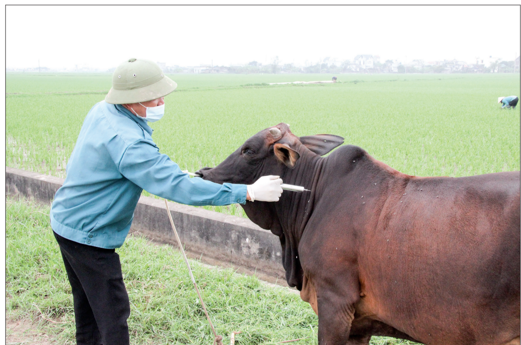
Hộ chăn nuôi xã Nam Chính (Tiền Hải) tiêm phòng cho gia súc.

nên năm qua dịch bệnh không làm ảnh hưởng đến đàn vật nuôi của gia đình. Không chỉ có các hộ chăn nuôi xã Nam Chính thực hiện tốt việc tiêm phòng cho đàn gia súc, gia cầm vụ xuân hè từ ngày 15/3 - 5/4 đạt kết quả tốt, Tiền Hải đã tập trung tuyên truyền các địa phương rà soát, thống kê lại tổng đàn gia súc, gia cầm ở các hộ, trang trại, gia trại trong diện tiêm. Chỉ đạo các đoàn thể tuyên truyền đến hộ hội viên, đoàn viên thực hiện nghiêm việc tiêm phòng cho đàn vật nuôi của gia đình mình. Tuyên truyền trên hệ thống truyền thanh cơ sở cách phòng, chống dịch bệnh trên động vật để người dân biết chủ động hợp tác và thực hiện nhằm nâng cao nhận thức, tự giác tiêm phòng đối với vật nuôi. Hiện nay, lượng vắc-xin đã cấp cho các xã là: 11.500 liều dịch tả, tụ độc 4.650 liều, phó thương hàn 3.000 liều, lở mồm long móng 5.975 liều, tụ huyết trùng trâu, bò 1.420 liều và vắc-xin đại 5.250 liều. Trạm