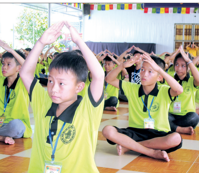
Các bạn trẻ được hòa mình trong không khí sôi động của các tiết mục văn nghệ.