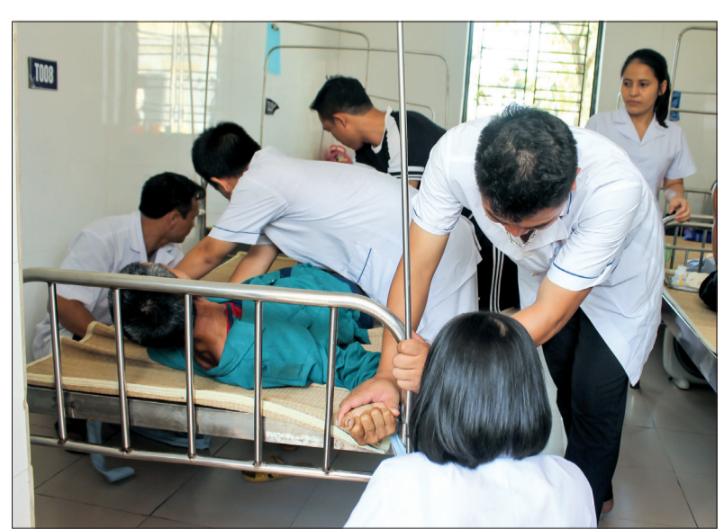
Bệnh nhân không kiểm soát được hành vi điều trị tại Bệnh viện Tâm thần Thái Bình.