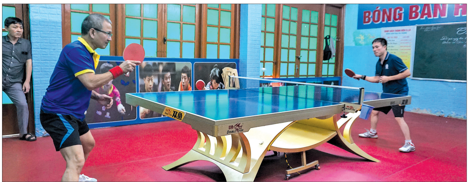
Bóng bàn thu hút người chơi ở mọi lứa tuổi.