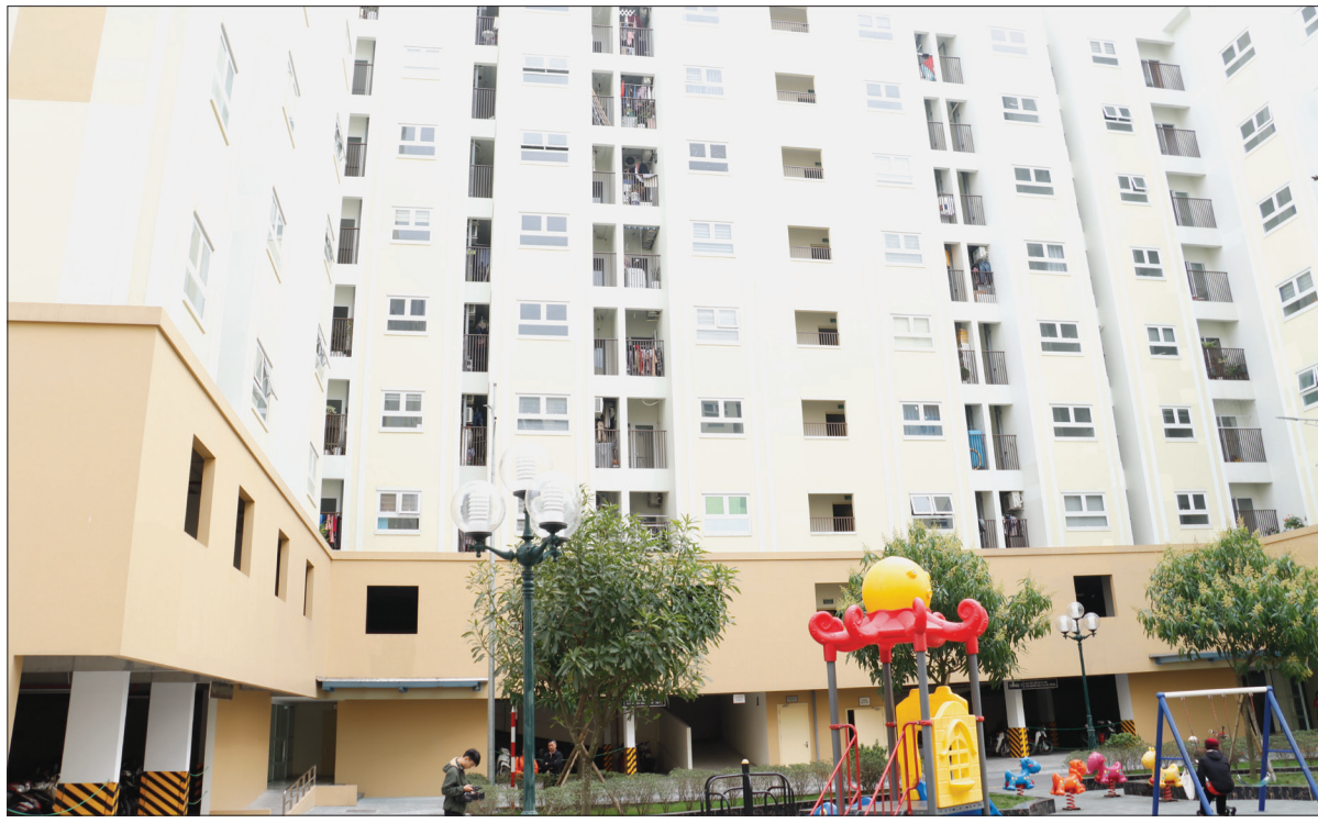
Nhiều hộ có thu nhập thấp, đối tượng chính sách nhờ được vay vốn nhà ở xã hội đã sở hữu căn hộ tại chung cư xã Vũ Phúc (thành phố Thái Bình).

Chương trình cho vay nhà ở xã hội (NOXH) là một trong những chính sách quan trọng của Chính phủ nhằm giúp người có thu nhập thấp, công nhân viên chức, cán bộ, chiến sĩ lực lượng vũ trang và các đối tượng chính sách có điều kiện mua, thuê, xây mới, sửa chữa nhà ở. Nguồn vốn từ chương trình đã giúp nhiều gia đình thực hiện giấc mơ an cư, góp phần bảo đảm an sinh xã hội.