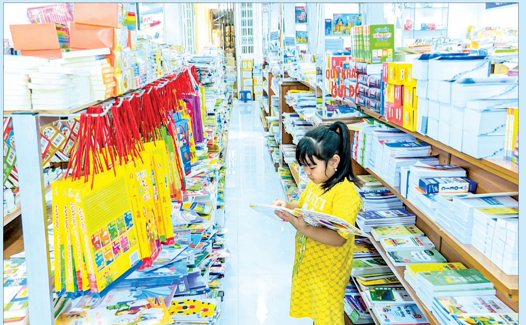
Những đồ dùng có nguồn gốc, xuất xứ rõ ràng được phụ huynh, học sinh lựa chọn để chuẩn bị cho năm học mới.