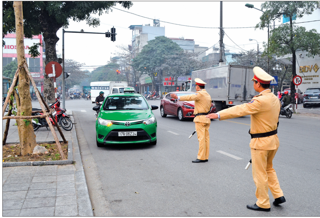
Lực lượng công an thành phố kiểm tra phương tiện tham gia giao thông.