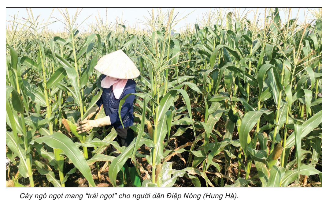
Cây ngô ngọt mang "trái ngọt" cho người dân Điệp Nông (Hưng Hà).