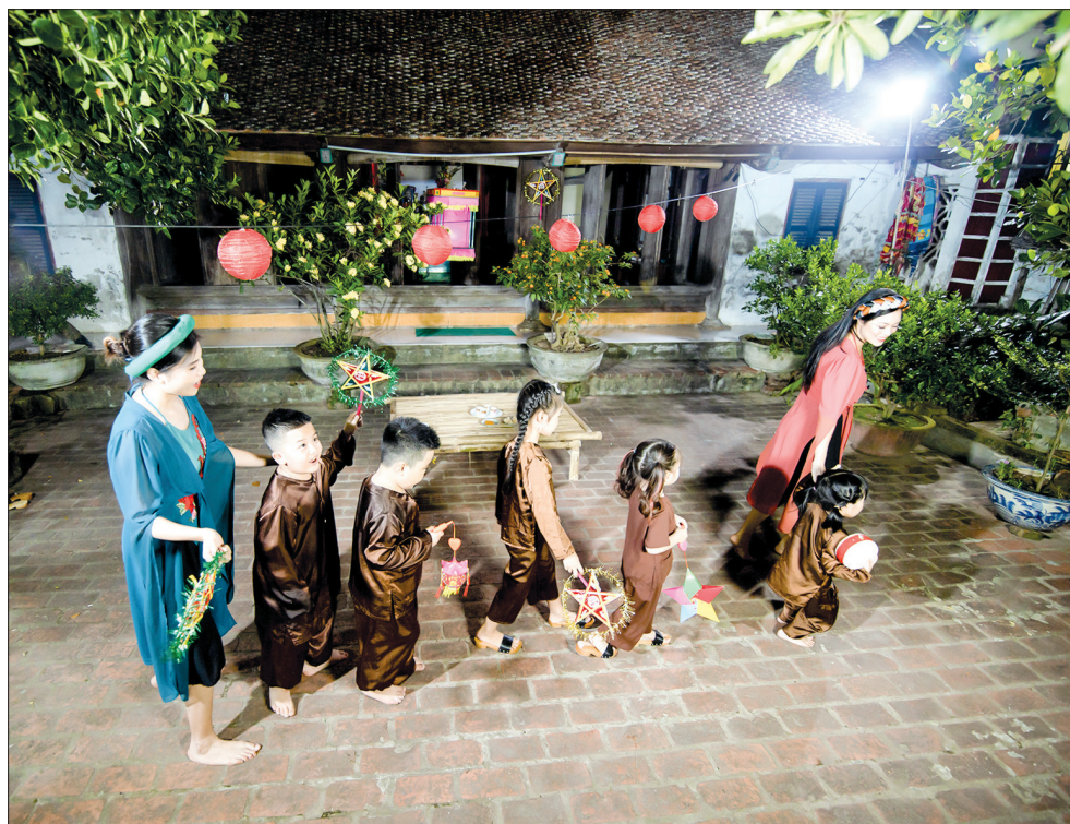
Niềm vui của các em nhỏ trong đêm Trung thu.

Từ những suy nghĩ trăn trở ấy đã hình thành lên ý tưởng và anh Thiện đã tận tay chuẩn bị những vật dụng gắn bó với