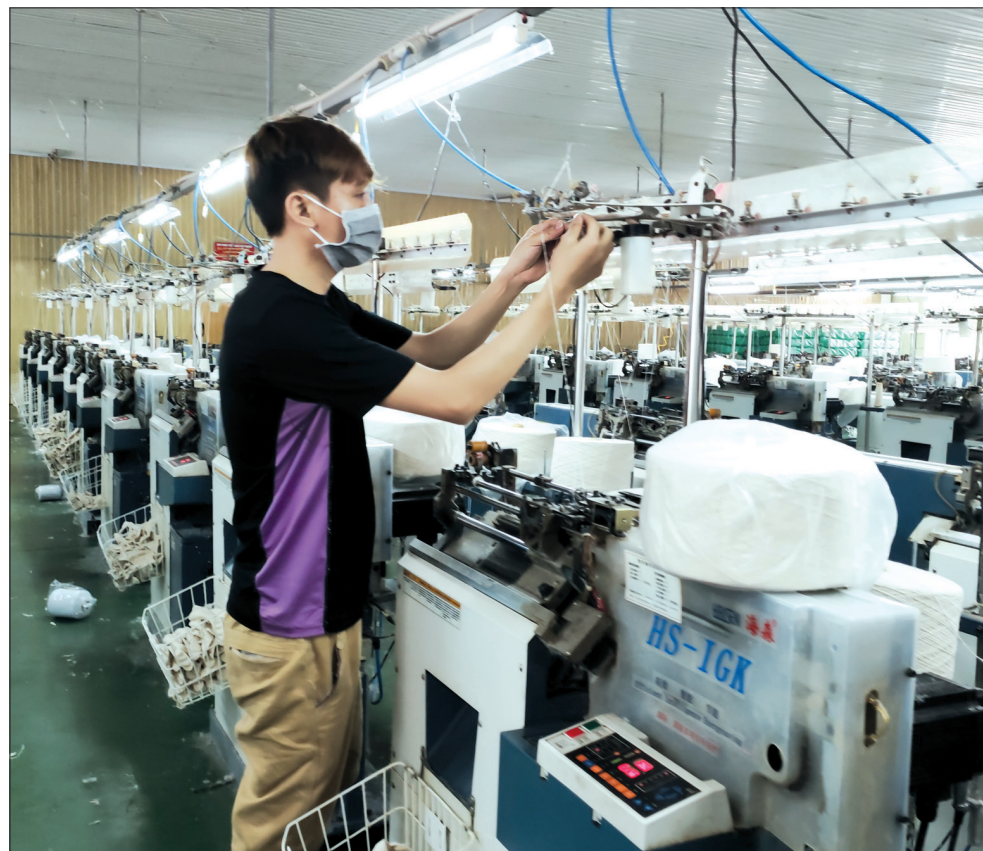
Sản xuất tại Công ty TNHH May Toàn Thắng (Hưng Hà).

Phát huy kết quả đạt được, thời gian tới, các cấp công đoàn trong tỉnh tiếp tục đổi mới về tổ chức và hoạt động, tăng cường tuyên truyền, giáo dục nâng cao nhận thức và bản lĩnh chính trị cho đoàn viên, CNVCLĐ. Tham gia xây dựng, hoàn thiện chính sách, pháp luật bảo đảm quyền, lợi ích hợp pháp, chính đáng của người lao động. Quan tâm tổ chức đào tạo, bồi dưỡng nâng cao trình độ học vấn, chuyên môn, kỹ năng nghề nghiệp cho người lao động. Đổi mới hoạt động cho phù hợp với số lượng, cơ cấu lao động, nhu cầu, nguyện vọng của đoàn viên, người lao động và yêu cầu hội nhập quốc tế. Phát huy vai trò nòng cốt của tổ chức công đoàn trong tham gia xây dựng Đảng, Nhà nước, hệ thống chính trị trong sạch, vững mạnh. Thực hiện tốt công tác phát triển đảng viên trong doanh nghiệp. Nâng cao chất lượng và đẩy mạnh các cuộc vận động, phong trào thi đua yêu nước, khuyến khích đoàn viên, CNVCLĐ thi đua học tập, lao động sáng tạo. Qua đó phấn đấu hoàn thành thắng lợi các mục tiêu, nhiệm vụ mà đại hội công đoàn các cấp đã đề ra, góp phần tích cực vào sự phát triển kinh tế - xã hội của địa phương.