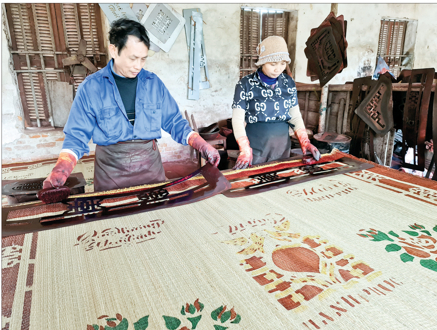
Họa văn trên chiếu cói Tân Lễ đặc sắc và đẹp mắt.

Để duy trì và giữ nghề truyền thống của xã, cấp ủy, chính quyền xã Tân Lễ thường xuyên tuyên truyền, vận động, trao đổi, gặp gỡ, nắm bắt khó khăn, tạo điều kiện thuận lợi về thủ tục theo quy định để các hộ mở rộng nhà xưởng. Đồng thời, động viên các cơ sở, người lao động ổn định tâm lý, duy trì hoạt động sản xuất, kinh doanh, tiếp tục thay đổi mẫu mã, nâng cao chất lượng sản phẩm, tạo thương hiệu cho chiếu Hới ngày càng bền vững.