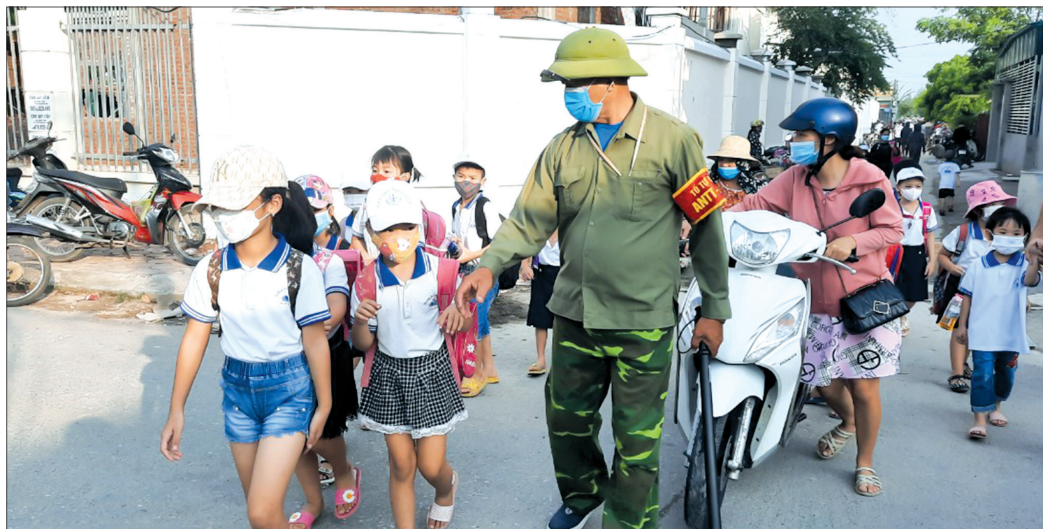
Thành viên tổ tự quản về an toàn giao thông của Hội Cựu chiến binh xã An Ninh (Tiền Hải) giúp học sinh qua đường.

Từ khi thành lập đến nay, mô hình tổ tự quản về an toàn giao thông (ATGT) của Hội Cựu chiến binh (CCB) xã An Ninh (Tiền Hải) đã phát huy hiệu quả tích cực, góp phần bảo đảm ATGT trước cổng trường học, được cấp ủy, chính quyền địa phương, nhân dân ghi nhận, hội CCB các cấp đánh giá cao.