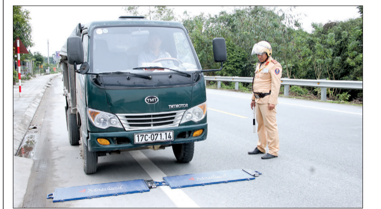
Lực lượng cảnh sát giao thông huyện Quỳnh Phụ kiểm tra tải trọng xe.

Từ đầu năm 2018 đến nay, qua công tác tuần tra, kiểm soát, lực lượng cảnh sát giao thông Công an tỉnh và công an các huyện, thành phố đã lập biên bản xử lý 32.762 trường hợp vi phạm Luật Giao thông đường bộ, tước 2.974 giấy phép lái xe các loại, tạm giữ 3.179 phương tiện.