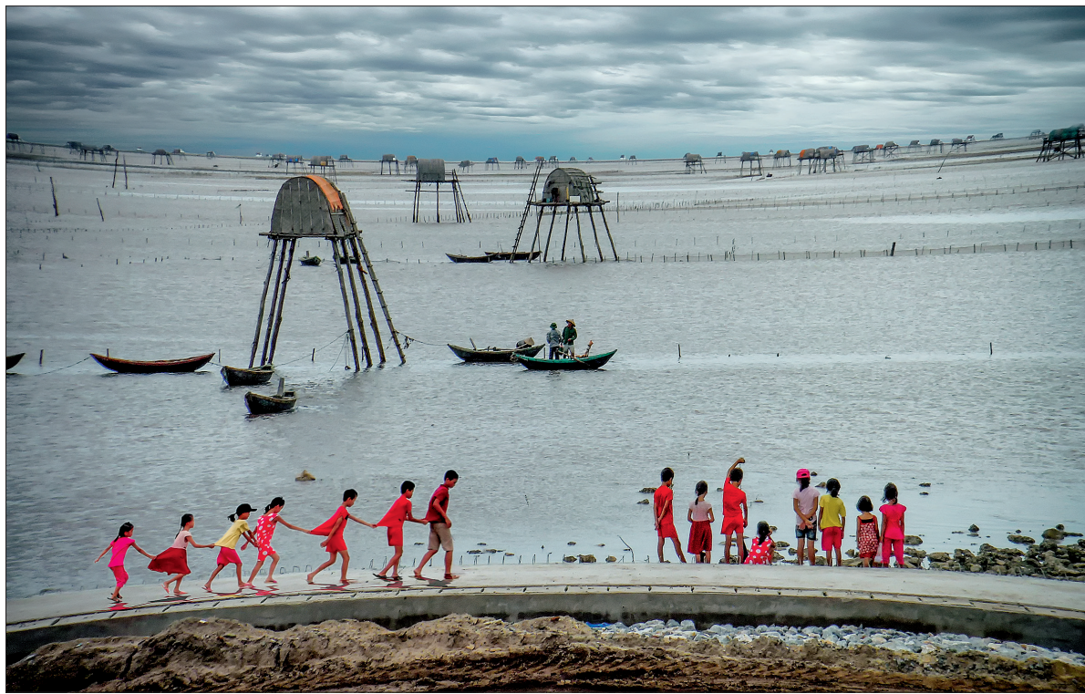
Đất đai Tiên Hải vẫn không ngừng vươn ra biển lớn.