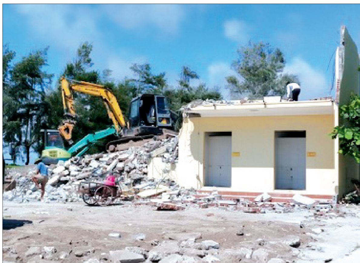
Công ty TNHH Đầu tư thương mại và xây dựng Tất Thành chấp hành nghiêm việc tháo dỡ trả lại hiện trạng ban đầu tại khu du lịch sinh thái cồn Vành.

Theo thống kê tại khu du lịch sinh thái cồn Vành có 1 tổ chức, 21 hộ lấn chiếm đất, xây dựng lều quán trái phép để kinh doanh tại 4 khu vực: khu vực dịch vụ 3 (DV3), dịch vụ 2 (DV2), khu vực quảng trường và khu vực rừng do ông Tô Văn Long quản lý. Những diện tích vi phạm nêu trên nằm trong 143ha đã được UBND tỉnh phê duyệt quy hoạch chi tiết. Trước thực trạng trên, huyện Tiền Hải đã thành lập tổ công tác cùng với xã Nam Phú và Ban Quản lý khu du lịch sinh thái cồn Vành rà soát và xác định vi phạm đối với các trường hợp trên. Trong đó, năm 2017, UBND xã Nam Phú đã ra quyết định xử phạt hành chính với các hành vi lấn chiếm đất đai, xây dựng trái phép, buộc các trường hợp vi phạm thực hiện biện pháp khắc phục hậu quả. Để bảo đảm tính nghiêm minh của pháp luật trong việc tiến hành giải tỏa, cưỡng chế đối với các hành vi vi phạm về đất đai, huyện Tiền Hải đã tiến hành triển khai các bước xử lý bảo đảm đúng trình tự theo pháp luật. Đến nay, huyện đã thành lập Ban Chỉ đạo cưỡng chế, đồng thời phối hợp với các sở, ngành, các địa phương tiến hành rà soát, thẩm định lại hồ sơ liên quan đến việc xử lý các sai phạm tại khu du lịch sinh thái cồn Vành. UBND huyện đã chỉ đạo tổ công tác của huyện trực