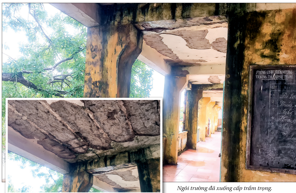
Ngoài trường đã xuống cấp trầm trọng.

Những ngày này, khi các trường học trên địa bàn tỉnh tung bừng đón năm học mới trong không khí vui tươi, phấn khởi thì thầy và trò Trường Tiểu học Quang Trung (Kiến Xương) lại phải "gồng mình" tăng tiết, tăng ca, học cả thứ bảy và chủ nhật, học trong những phòng học tạm bợ, chật hẹp như nhà ăn, thư viện, phòng hội đồng... Nguyên nhân là do một dãy nhà 10 phòng học của Trường đã xuống cấp trầm trọng, có thể sập bất cứ lúc nào.