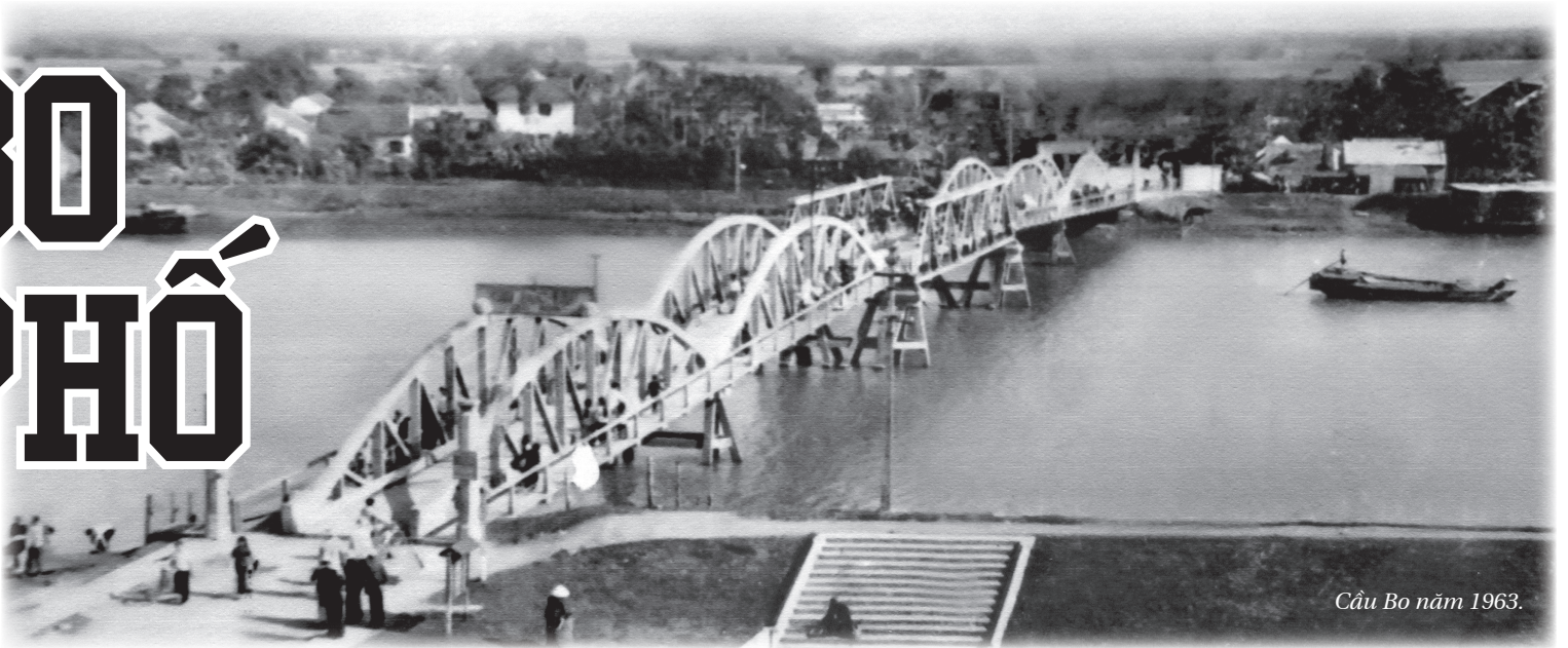
Cầu Bo năm 1963.

Ô ng Vị kể về cái đoạn phiến muộn, hai ông đưa thú về gặp phải bao cảnh khó khăn. Ông bảo: