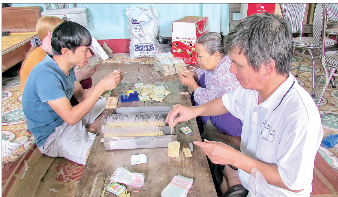
Người khiếm thị làm việc tại cơ sở sản xuất tăm tre thuộc Hội Người mù huyện Thái Thụy.