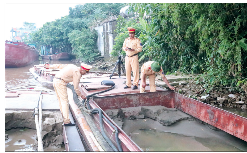
Lực lượng chức năng kiểm tra, tạm giữ phương tiện khai thác cát trái phép trên sông Hồng.

Được biết, tình trạng khai thác cát trái phép tại khu vực này đã diễn ra từ lâu, hết sức phức tạp, gây bức xúc trong quần chúng nhân dân. Các phương tiện trên thường hoạt động liên tục, lợi dụng đêm tối, xa khu dân cư khu vực giáp ranh trên sông Hồng giữa hai tỉnh Nam Định - Thái Bình để khai thác cát trái phép.