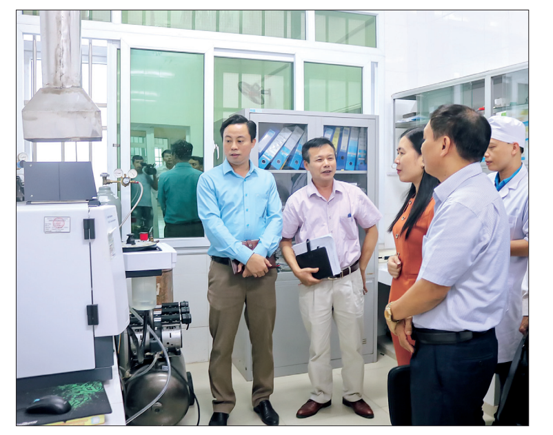
Đoàn giám sát Ban Văn hóa - Xã hội, HĐND tỉnh khảo sát trang thiết bị tại Trung tâm Kiểm soát bệnh tật tỉnh.

trên được bàn giao về CDC để phục vụ công tác khám và điều trị bệnh cho nhân dân. Giai đoạn 2016 - 2019, CDC đã triển khai thực hiện xã hội hóa, đầu tư mới 2 trang thiết bị hiện đại gồm: máy sinh hóa, miễn dịch Cobas 8000 và máy xét nghiệm đông máu. Các trang thiết bị y tế được quản lý, sử dụng có hiệu quả, không có tình trạng mất mát hoặc sử dụng sai mục đích, các trang thiết bị y tế hư hỏng đã được sửa chữa kịp thời. Tuy nhiên, CDC chưa có cán bộ chuyên môn trong lĩnh vực quản lý trang thiết bị y tế, một số trang thiết bị đã lạc hậu, việc ứng dụng công nghệ thông tin trong quản lý trang thiết bị y tế chưa được triển khai đồng bộ. CDC đã nêu kiến nghị, đề xuất về việc nâng cấp, đầu tư trang thiết bị mới, hiện đại; tạo cơ chế thuận lợi để đơn vị đẩy mạnh công tác xã hội hóa đầu tư trang thiết bị y tế.