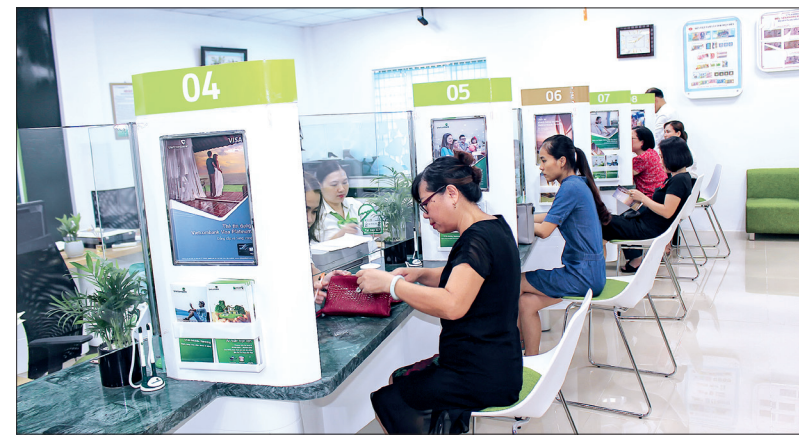
Hoạt động giao dịch của Ngân hàng Thương mại cổ phần Ngoại thương Việt Nam Chi nhánh Thái Bình tại Phòng giao dịch Quang Trung (thành phố Thái Bình).