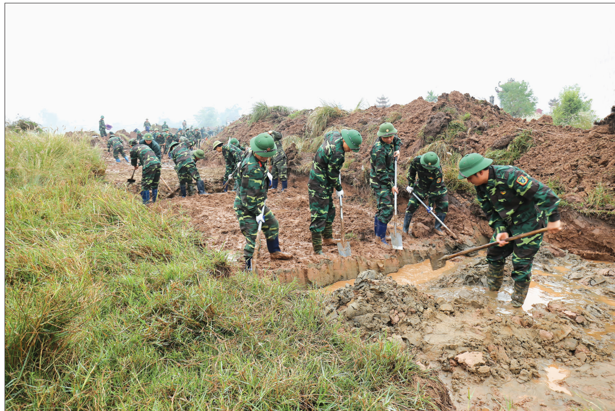
Lực lượng vũ trang tỉnh tham gia tìm kiếm hài cốt liệt sĩ.