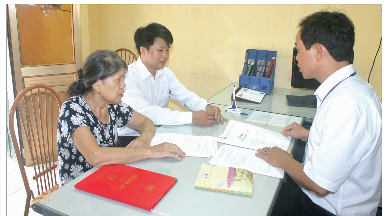
Cán bộ Trung tâm Trợ giúp pháp lý, Sở Tư pháp tư vấn pháp luật cho người dân.