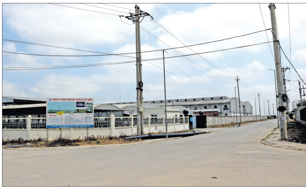
Hạ tầng tốt, cụm công nghiệp Minh Lãng (Vũ Thư) đã thu hút được nhiều dự án đầu tư thứ cấp lớn vào hoạt động.

Vũ Thư là huyện duy nhất của tỉnh đạt tỷ lệ 100% cụm công nghiệp (CCN) có nhà đầu tư xây dựng và kinh doanh hạ tầng CCN. Việc thu hút nhà đầu tư hạ tầng không chỉ giảm gánh nặng ngân sách nhà nước cho hoạt động đầu tư công mà còn giúp các CCN sớm đi vào hoạt động góp phần đưa công nghiệp địa phương phát triển mạnh.