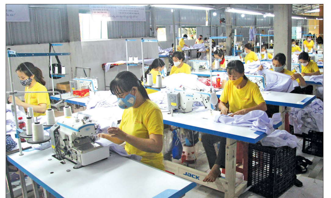
Xưởng sản xuất đồng phục của Công ty TNHH Đồng phục và quà tặng Thái Bình, xã Nam Hồng (Tiên Hải) tạo việc làm cho nhiều lao động địa phương.