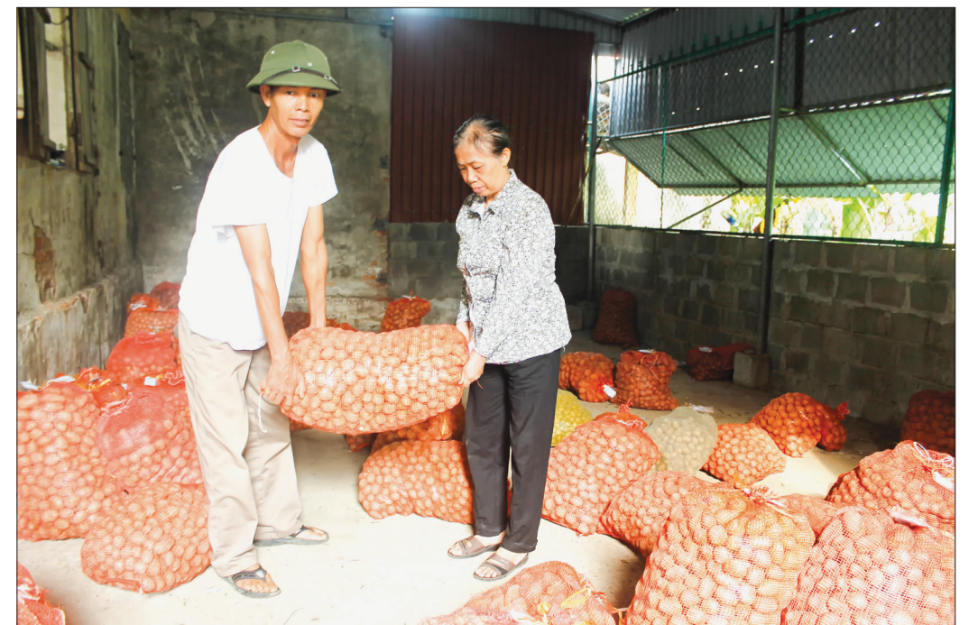
HTXNN xã Nguyễn Xá chịu trách nhiệm cung ứng giống khoai tây sau đó sẽ thu mua, bảo quản và cung ứng, bảo đảm đầu ra cho nông dân.