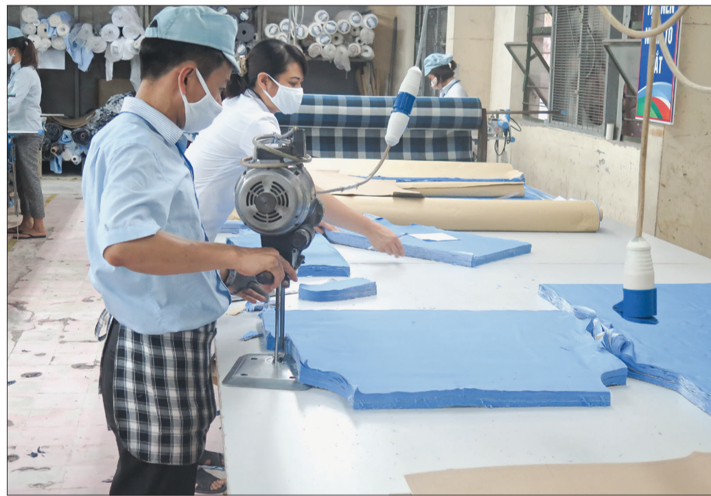
Hầu hết các sản phẩm may công nghiệp của các doanh nghiệp trong tỉnh đều xuất khẩu sang thị trường nước ngoài.