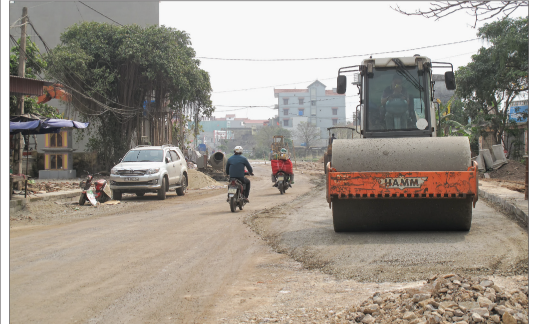
Công tác giải phóng mặt bằng đường ĐT456 cơ bản hoàn thành.

Trong quá trình triển khai các dự án, trong đó có nhiều dự án trọng điểm mang tầm quốc gia, công tác bồi thường giải phóng mặt bằng (GPMB) được huyện Thái Thụy xác định là một trong những yếu tố quan trọng giúp bảo đảm tiến độ các dự án cũng như thu hút đầu tư.